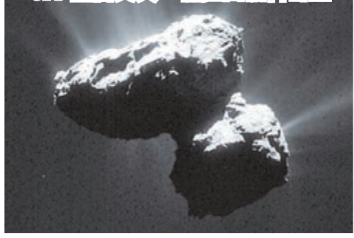
67P丘留莫夫-格拉西緬科彗星