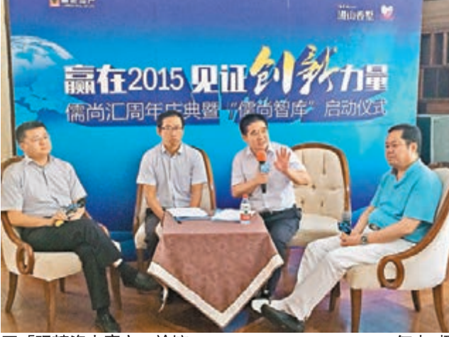
「玩轉資本魔方」論壇。

儒尚匯發起者鄭重在致辭中表示，儒尚匯作為一個聚集企業家的圈子，成立一年來已經匯聚了全國商界以及各領域專家學者近800人，成功舉辦了數10場私董會、資本對接會、主題論壇等活動，贏得企業家的讚譽。鑒於此，為了給企業家提供更好的服務，儒尚匯與中國傳媒大學MBA學院聯合建立了私募與資本運營(PE)專業，將在今年招收首屆學員。據了解，該專業將聘請國內各領域知名的專家教授為學員授課。招收對象為董事長、總經理等企業高管；銀行及金融投資機構高等。學習期間將定期舉辦「實踐導師講座」和「私募資本沙龍」，組織國內外知名私募投資機構投資人點評、對接學員的優秀項目，在實現學員知識、技能、實戰提升中，最大程度的解決學員企業的融資渠道。