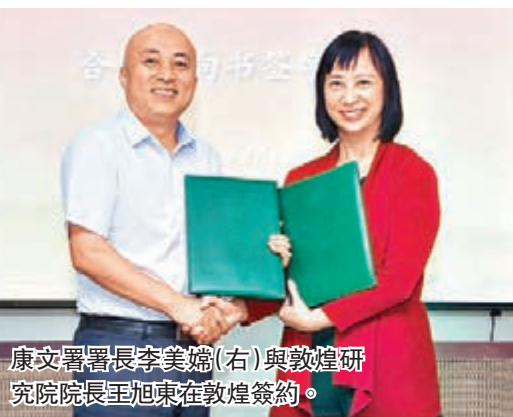
康文署署長李美嬌(右)與敦煌研究院院長王旭東在敦煌簽約。

另外為向旅客提供便捷服務,機場管制科於2006年11月在機場內的各個出入境大堂設立「專用服務櫃檯」。各個專用服務櫃檯可以作為「禮遇通道」,供外交護照持有人及有需要人士使用。「禮遇通道」亦可用於香港國際機場「訪港常客證通道」,方便曾於過去12個月內經由香港國際機場到訪香港3次或以上並獲機管局簽發訪港常客證的旅客。