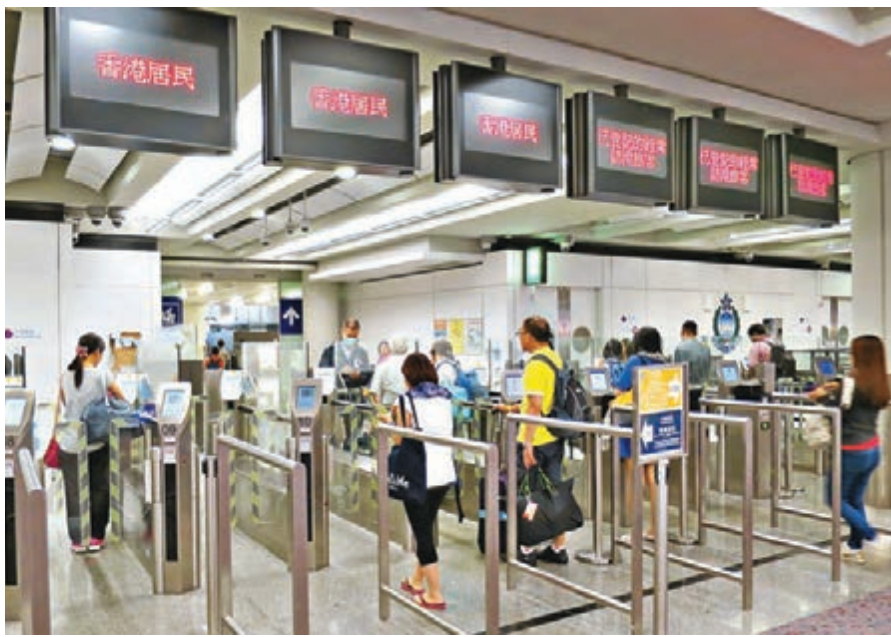
經常訪港旅客(過去12個月訪港3次以上)可登記使用e-道快速通行的措施備受歡迎。