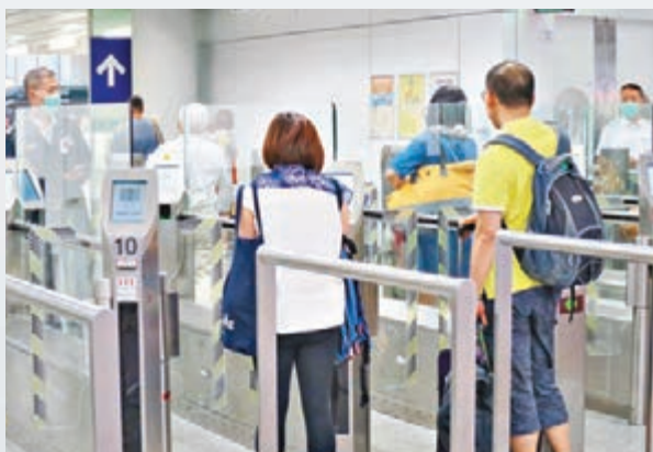
入境處將於明年為機場加設18條新e-道,料明年暑假前完工,冀進一步提升接待旅客能力。

香港文匯報訊(記者 郭兆東) 入境處憑著不斷推出各種便利旅客措施,贏得「Skytrax 2015年全球最佳機場出入境服務」大獎。據入境處介紹,今年首7個月,已累積逾2,600萬人次出入境,按年上升逾6%,因應旅客流量持續上升,入境處在新系統配合下會研究過往數據,預測來港人數,作出適當部署。另外,經常訪港旅客(過去12個月訪港3次以上)可登記使用e-道快速通行的措施備受歡迎,入境處計劃明年為機場加設18條新e-道,預計明年暑假前完工,冀進一步提升接待旅客能力。