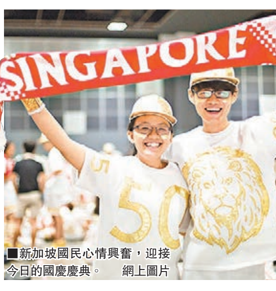
新加坡國民心情興奮，迎接今日的國慶慶典。網上圖片