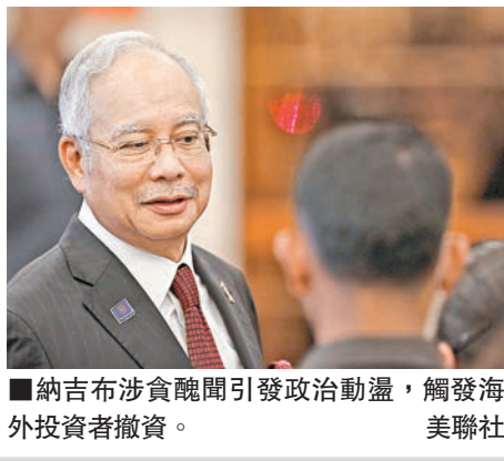
納吉布涉貪醜聞引發政治動盪，觸發海外投資者撤資。