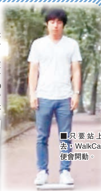
只要站上去，WalkCar便會開動。