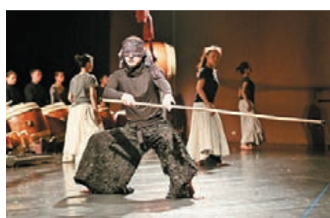
優人神鼓與柏林廣播電台合唱團《愛人》

1944年的演出後，畫作《瘋狂崔斯坦》便被私人收藏，從此消失在公眾視野中。直到帕斯卡開始構思自己的新演出，畫作的主人突然來電，願意提供畫作之餘更給他極大的自由去運