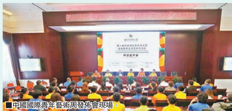
中國國際青年藝術周發佈會現場。

第八屆中國國際青年藝術周將於8月12日至28日舉行，本屆青年周期間，以北京為主會場，分會場遍及上海、廣州、濟南、蘭州、西寧、廈門、珠海、德州等8座城市，將有157個中外優秀節目與觀眾見面，藝術形式涵蓋音樂會、話劇、舞蹈、戲曲綜藝、舞台劇、音樂劇、歌劇等，總演出場次達550場，創歷屆之最。與以往不同的是，為紀念中俄兩國在抗戰中結下的深厚友誼，中方邀請俄羅斯擔任中國國際青年藝術周的首個主賓國，俄方將包攬開、閉幕式演出。