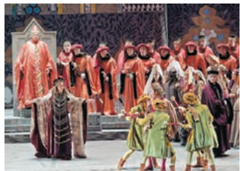
都靈皇家劇院《父女情深》

「達利的景象屬於白天或是黑夜？答案是：都不是！它們屬於另一個維度——夢的維度。」帕斯卡這麼說過。的確，窺探夢境與意識，有什麼比超現實大師達利的藝術更為貼