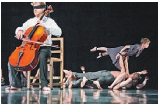
無界雜技團《大動作》

切？《真相奇幻坊》的靈感正來源於達利的巨幅畫作《瘋狂崔斯坦》，背後還有一段兜兜轉轉的故事。