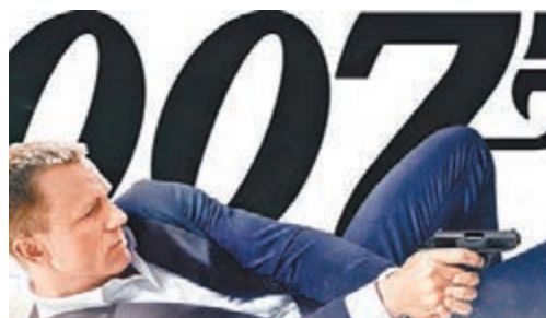
電影的一些鏡頭並不現實。

生又以布希·韋利士於一九八八年主演的《虎膽龍威》(Die Hard)為例，男主角是紐約警察，碰到恐怖分子搶劫大樓金庫裡的六億元債券。他引爆頂樓炸彈，炸毀直升機，然後用消防栓水管綁住自己，往大樓外縱身一躍……。醫生認為，這位警察英雄在末中槍身亡前，可能已經頭斷骨折，極度痛苦。