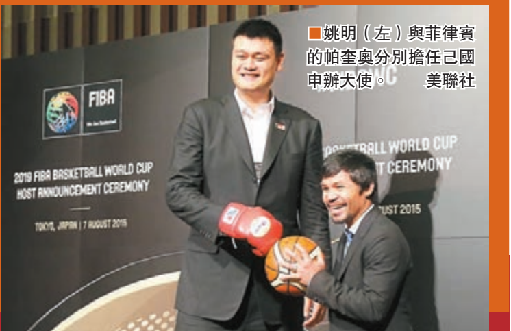
姚明(左)與菲律賓的帕奎奧分別擔任己國申辦大使。

此次中國申辦的口號是「更多參與，共贏未來」。張建東表示，更多的參賽球隊，更多的承辦城市，定會給2019年的男籃世界盃帶來更多關注。