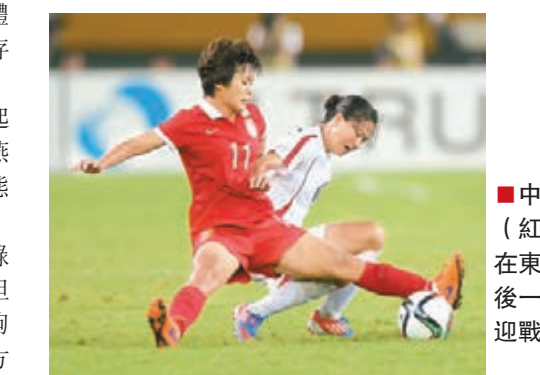
中國女足(紅衫)將在東亞盃最後一場比賽迎戰日本。