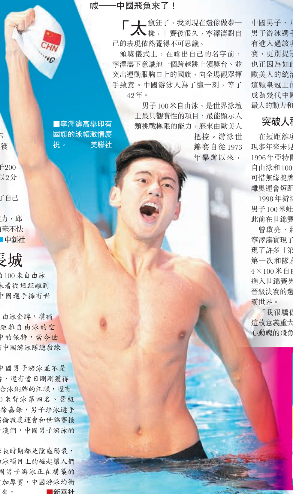
寧澤濤高舉印有國旗的泳帽激情慶祝。

在喀山游泳世錦賽賽場，向來低調含蓄的寧澤濤展示出了前所未有的激情：將泳帽高高舉起，指着自己的姓氏NING大吼，彷彿在向世界發出吶喊——中國飛魚來了！