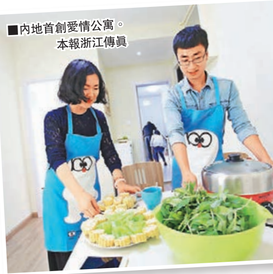
內地首創愛情公寓。

房屋租賃中介原本是個再普通不過的傳統行業，但是內地紅娘網原CEO羅仙林卻利用互聯網，使其成為沒有秘密的完全開放平台。同時，在租客合租公寓裡植入愛情主題，使其成為愛情公寓。據了解，駐客網自今年初創辦以來，目前已在浙江杭州自主打造近500套租客公寓，不僅吸引了200多位杭州青年白領入住，而且A輪融資時獲得了超1,000萬元的天使創業基金注入。