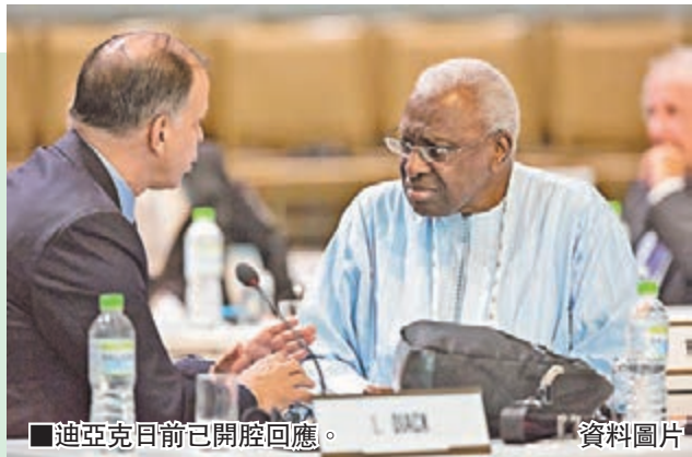
■迪亞克日前已開腔回應。資料圖片

繼主席親自發聲後，國際田聯周二終首次發表正式聲明，強烈抗議西方媒體近日爆出的所謂田徑運動涉嫌大規模濫用禁藥的新聞。英國《星期泰晤士報》和德國廣播電視聯合會(ARD)日前同時爆料，稱拿到來自5千多名田徑運動員的1.2萬多份興奮劑血檢結果，其中樣本檢測結果有疑團的運動員多達8百人。2名反興奮劑專家提供的血樣檢測結果顯示，2001年至2012年的11年間，三分之一的奧運會、世錦賽獎牌得主的血檢結果存疑。針對這則「猛料」，國際田聯主席迪亞克周一予以否認，直指這些報道是針對田徑運動的一次陰謀。國際田聯周二則發表長篇聲明重申這一立場，形容這些報道「嘩眾取寵、含糊其辭」，其引用的資料毫無秘密可言，都是國際田聯4年前就公佈過詳盡分析的數據。聲明認為兩家媒體指控國際田聯失職的說法是錯誤的：「所謂血檢結果存疑，即沒有確鑿的陽性反應證據，而兩家媒體也承認這一點。《星期泰晤士報》的故事主要說的是