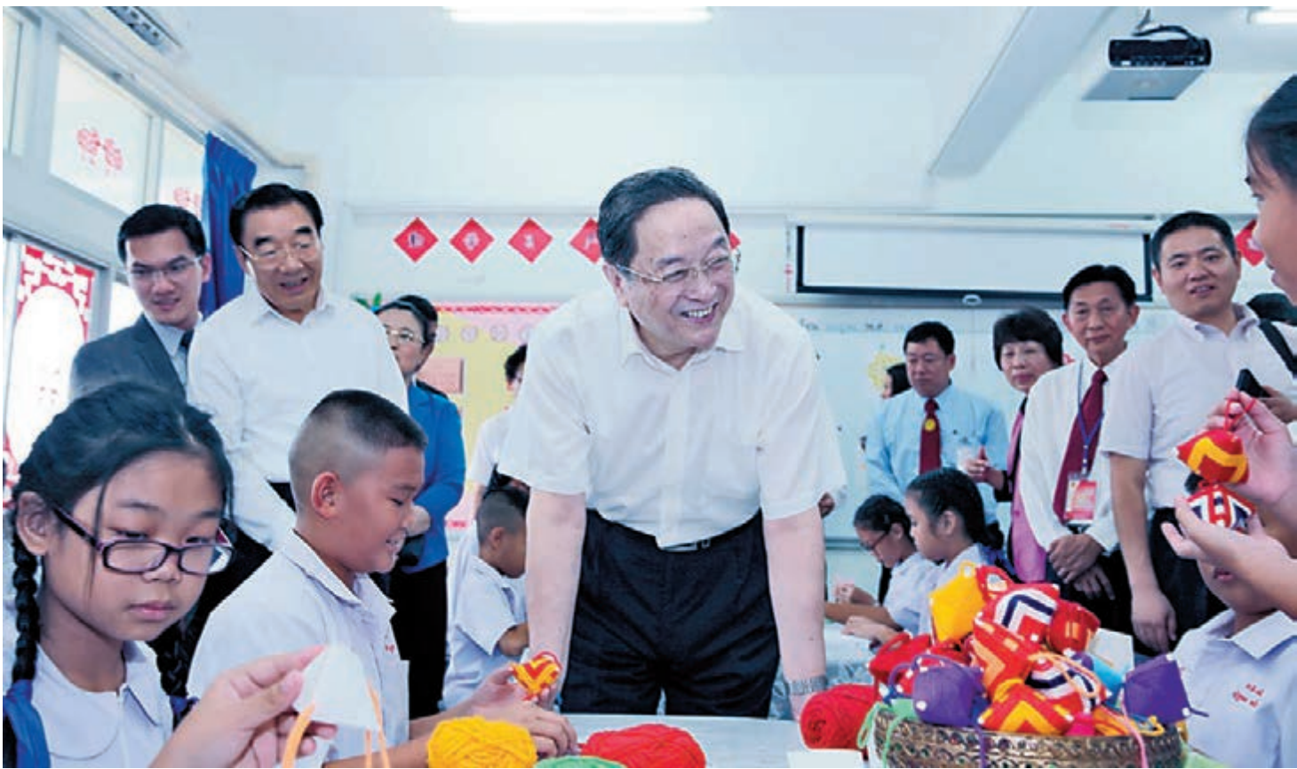
俞正聲在清邁考察崇華新生華立學校時與學生們交流。