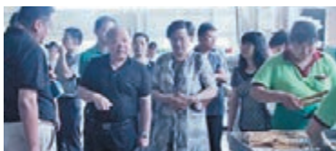
市政協經濟委考察淨菜銷售推廣情況。本報北京傳真

香港文匯報·人民政協專刊訊（記者 馬曉芳）北京市政協近日舉行重點提案督辦考察，委員建議北京市搭建淨菜產業市場平台體系，將淨菜逐漸推廣進入社區，使居民能夠便捷地購買到放心且便宜的淨菜。