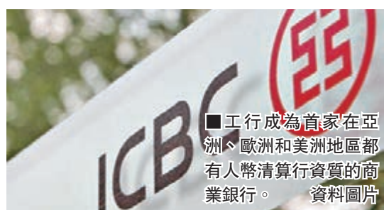
工行成為首家在亞洲、歐洲和美洲地區都擁有人民幣清算行資質的商業銀行。資料圖片