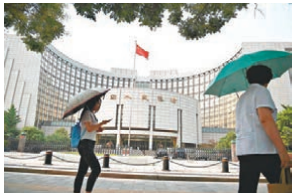
人行表示，下半年將繼續實施穩健的貨幣政策，創新和完善宏觀調控的思路和方式，更加注重鬆緊適度。

會議還指出，將進一步完善人民幣匯率形成機制，保持人民幣匯率在合理均衡水平上的基本穩定。全面深化金融改革開放，增強金融體系的動力活力，提高金融運行效率和服務實體經濟能力。進一步建立健全風險預警、識別和處置機制，注重穩定金融市場預期，有效防範化解金融風險。扎實推進金融市場基礎設施建設，全面提升金融服務與管理水平。