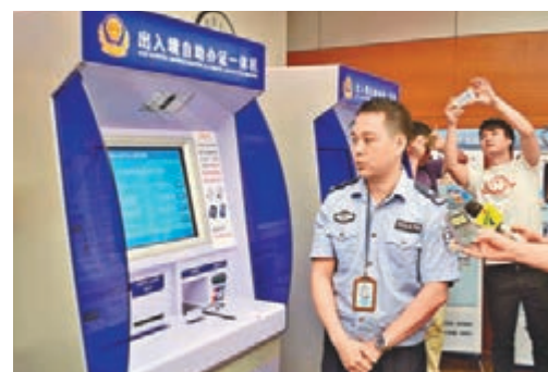
出入境自助辦證一體機即將在廣東全省推廣。

香港文匯報訊（記者 敖敏輝 廣州報導）廣東居民辦理赴港簽證將實現5分鐘「立等可取」。廣東省公安廳發佈公安改革惠民措施「20條」，其中在運作最為成熟的港澳通行證方面，居民在「出入境自助辦證一體機」上辦理再次簽證，將自動審批、製證和發證，實現「立等可取」，並可即刻啟程赴港。而該政策推出之前，居民再次簽證時間需要7個工作日，而現在耗時不足5分鐘，大大方便廣東居民赴港澳。