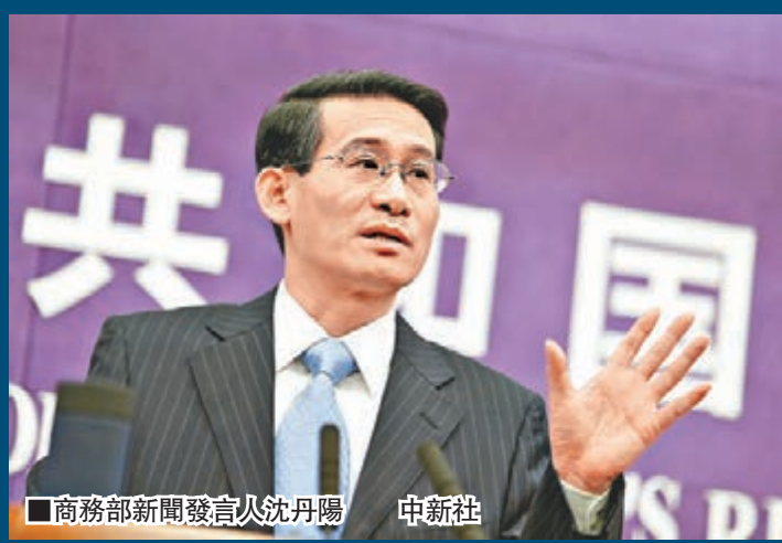
商務部新聞發言人沈丹陽