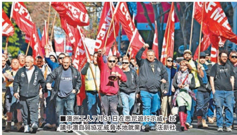
澳洲工人7月31日在悉尼遊行示威，抗議中澳自貿協定威脅本地就業。

對此，沈丹陽強調，中澳自貿協定允許重大建築項目用中國工人代替當地工人，與實際情況是不符的，因為中方工程技術人員赴澳工作須符合若干重要前提條件。沈丹陽介紹，條件之一是中方在澳投資的重大基礎設施項目投資額須達到1.5億澳元；其次，項目公司必須在澳註冊成立，嚴格遵守澳法律法規；第三，中方投資項目須接受澳移民和邊境保護部的監督和管理，並須於澳移民和邊境保護部協商確定項目涵蓋的職業範圍、職業資格和語言要求等。「我們認為，中澳自貿協定簽署後，將