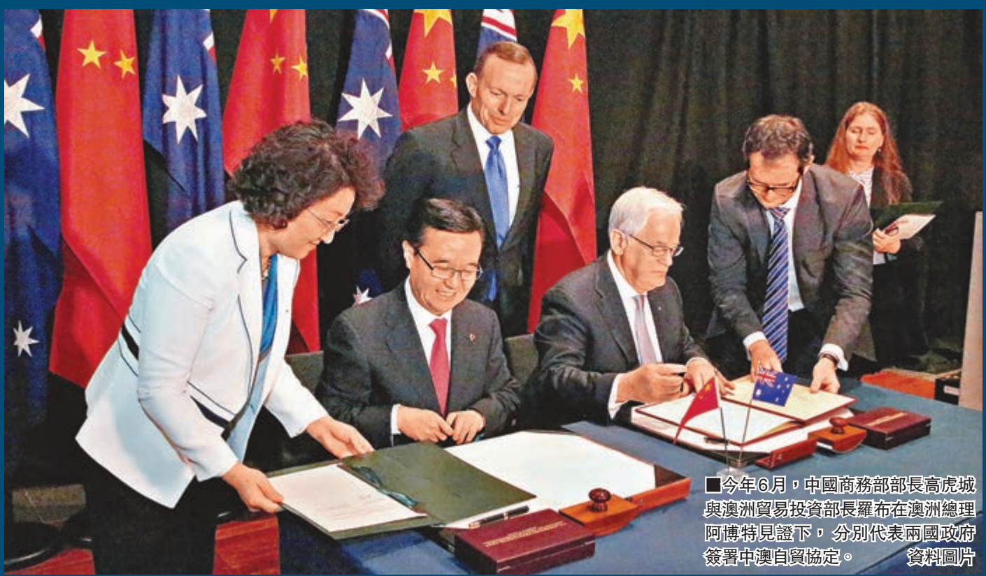
今年6月，中國商務部部長高虎城與澳洲貿易投資部長羅布在澳洲總理阿博特見證下，分別代表兩國政府簽署中澳自貿協定。 資料圖片

香港文匯報訊（記者 馬琳 北京報導）針對近日澳洲工人抗議中澳自由貿易協定（FTA）威脅澳洲就業機會，中國商務部新聞發言人沈丹陽昨日在北京表示，這是個別媒體斷章取義的報道，與實際情況是不符的。中澳自貿協定簽署後，將有更多的中國企業赴澳投資，這不僅不會威脅澳洲人們的就業機會，還為當地居民提供更多的就業機會。