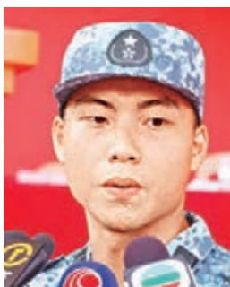
▲歐烜朗希望可增強體格、培養紀律和守時觀念。