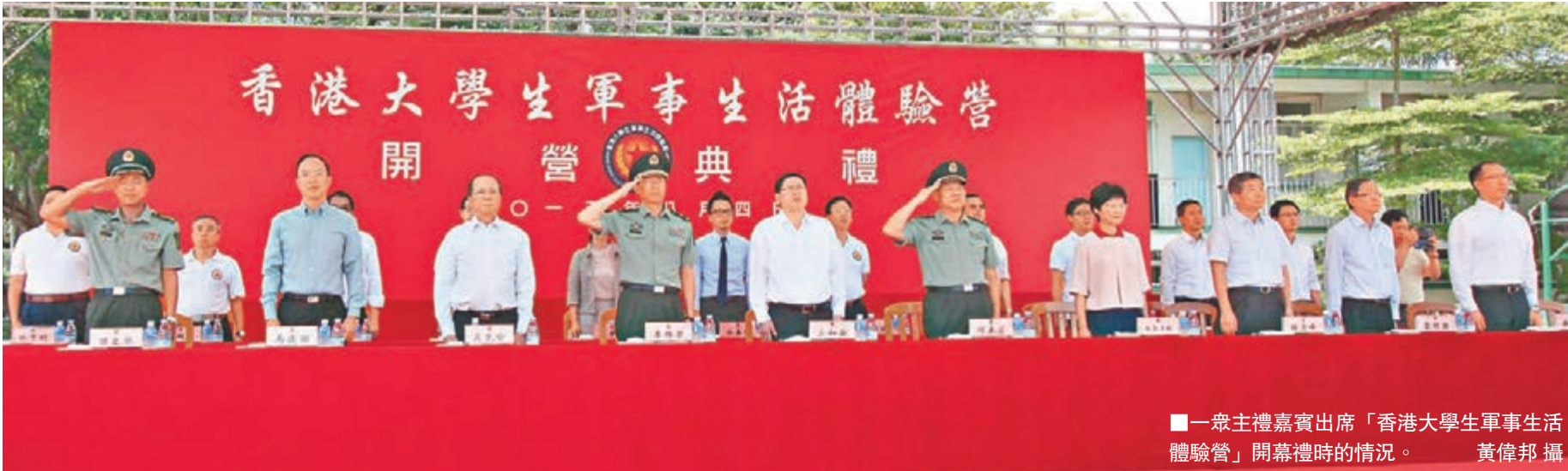
■一眾主禮嘉賓出席「香港大學生軍事生活體驗營」開幕禮時的情況。

香港文匯報訊（記者 黎志）第五屆「香港大學生軍事生活體驗營」昨日於解放軍駐港部隊粉嶺新圍軍營舉行開幕典禮。來自全港16間大專院校、共90名學生，自本月3日起入營13天，體驗刻苦且有紀律的軍人生活，以磨練出堅定意志、不畏困難的精神。解放軍駐港部隊司令員暨香港大學生軍事生活體驗營榮譽主席譚本宏中將表示，希望參與活動的大學生可以珍惜是次機會，以優異表現證明自己，並為實現人生理想、為將來建設香港、為報效祖國打下堅實的基礎。