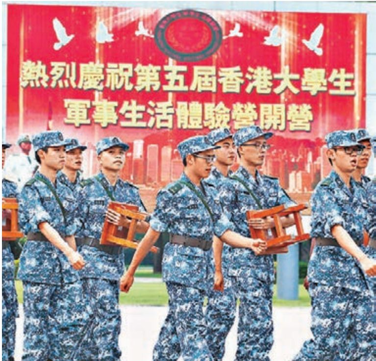
■來自16間大專院校的90名大專生參與「香港大學生軍事生活體驗營」。