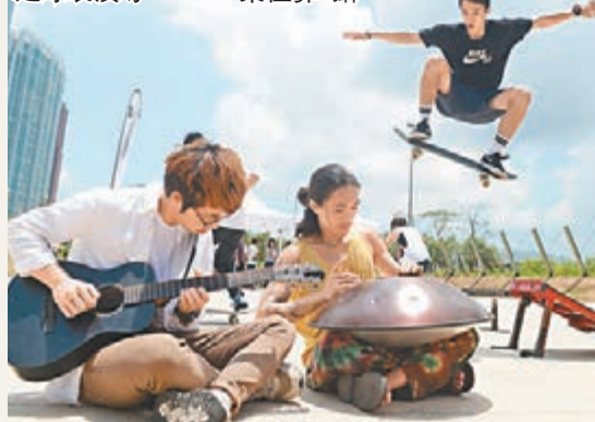
西九舉辦「自由約」活動，打頭陣會先有滑板比賽及花式足球表演等。

對於被指是外行人領導內行人，栢志高稱，團隊的成員對藝術、博物館及文化都富有經驗，而自己的工作是一令每個人做好自己職責，及確保文化區以文化先行。