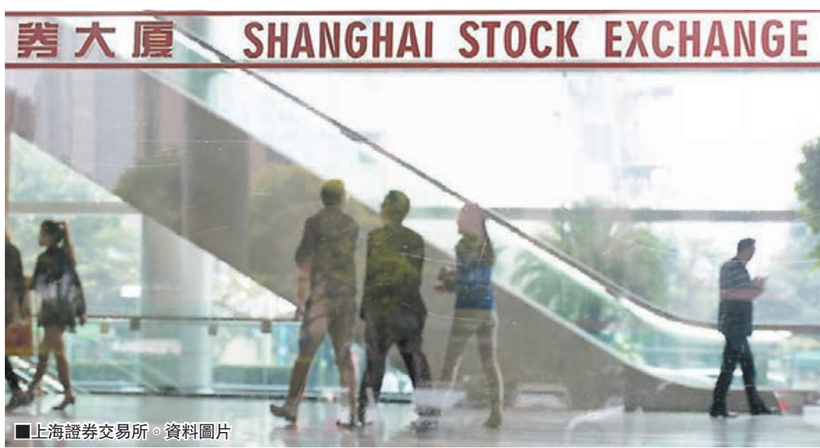
上海證券交易所。

香港文匯報訊(記者張易孔雯瓊)中證監就沽空進行核查,繼上周五10個機構賬戶遭上交所限制交易3個月後,上交所昨再發通知,對4個證券賬戶採取交易限制,限制期為3個月。相比上周五10個交易賬戶均為機構賬戶,今次均為個人賬戶,當中不乏城中聞名的「超級散戶」。計及昨日4個賬戶,自上周五以來,滬深兩市已合共限制38個異常交易賬戶,其中上交所18個,深交所20個。