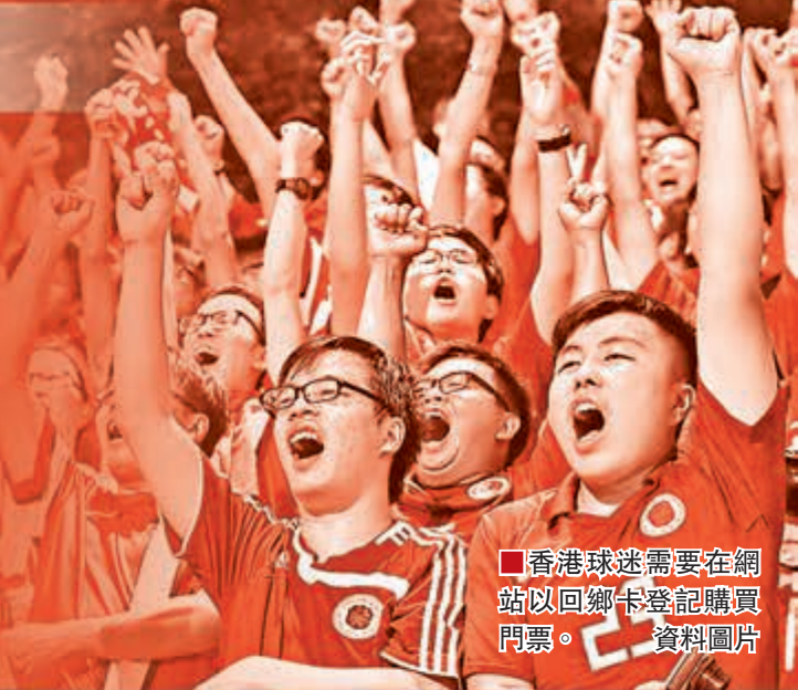
香港球迷需要在網站以回鄉卡登記購買門票。資料圖片