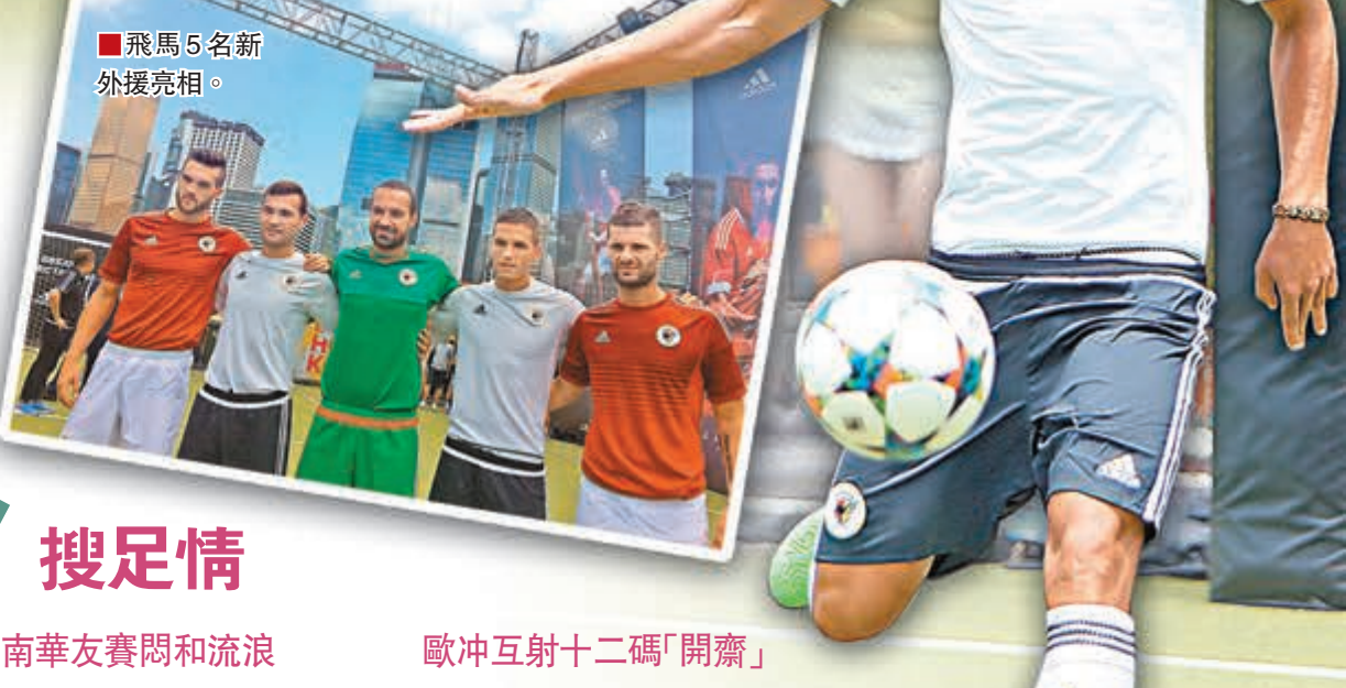
飛馬5名新外援亮相。