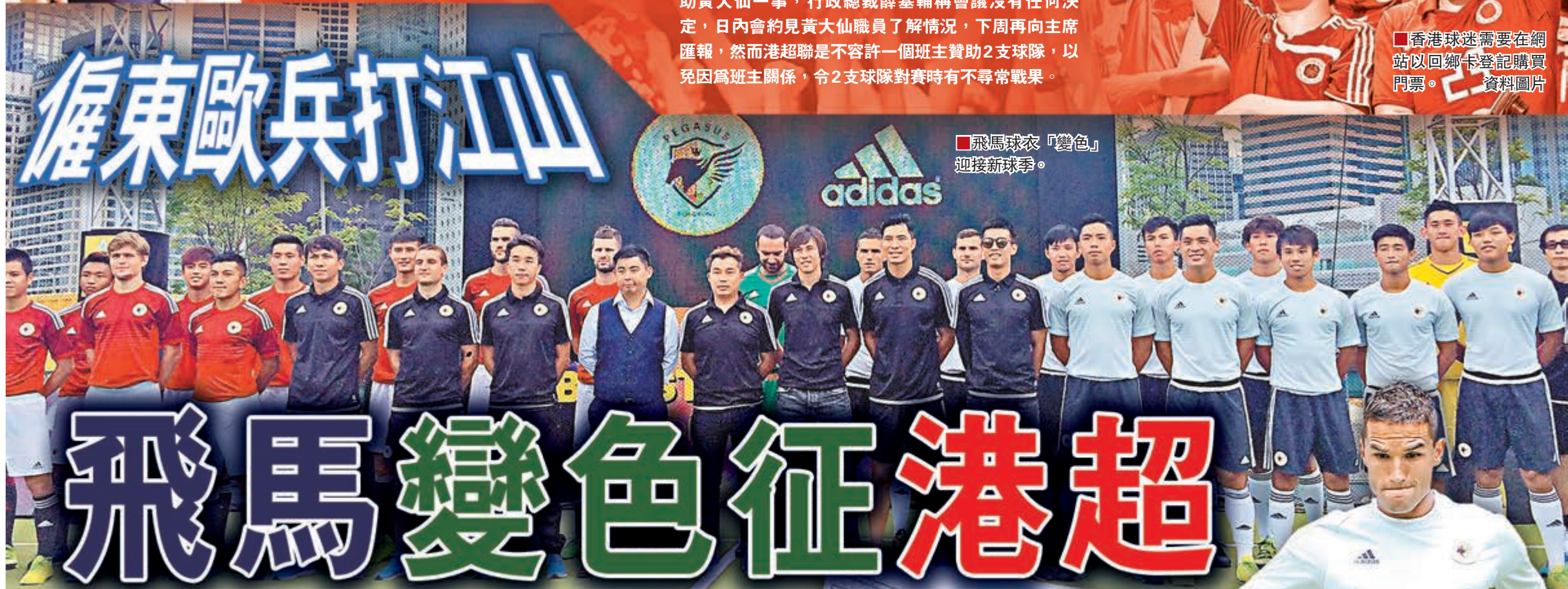
飛馬球衣「變色」迎接新球季。

僱東歐兵打江山 飛馬變色征港超 香港文匯報訊(記者 郭正謙)「紅衣」飛馬再展翅！以全新面貌示人的飛馬，今季由高層以至球員班底均有極大變動，連傳統的「黃金戰衣」也換上一襲醒目的紅色球衣，誓要在新一季港超，掀起一場青春風暴。