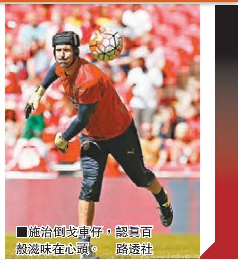
■施治倒戈車仔，認真百般滋味在心頭。

在比賽舉行前夕，摩連奴出席記者會時談及自己的年齡問題，因現年52歲的他尚算年輕，較65歲的雲加甚至67歲的新特蘭主帥艾禾卡特後生。摩帥誓言要步前曼聯領隊費格遜的後塵，教波教到70歲也不輕言退下來，他深信自己仍有至少20載黃金時期。