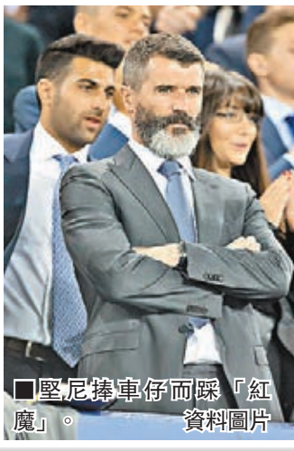
■堅尼捧車仔而踩「紅魔」。

前曼聯（紅魔）暨愛爾蘭球星堅尼，向來愛公開批評挑起是非，最近他直指舊東家今季依然要為爭標而掙扎，難以超越去季皇者車路士（車仔），同時又指紅魔失去昔日的輝煌價值，不復往年勇。儘管「魔帥」雲高爾今夏繼續揮金擴軍，但仍未能讓堅尼感到滿意，堅尼昨日跟愛爾蘭《星期日世界報》表示：「曼聯已從本來的那裡走得很遠。有點像80年代尾，買入很多認為很棒的球員——不過那不會很快奏效，當然他們今年定必更強。雲高爾今年有充實的季前備戰，我看到他們（指球員）的確很好，只是去年季前賽也是如此。我不認為曼聯的骨幹夠強，覺得他們仍需要一名中堅。」並表明如要投注，他寧選車仔稱冠也不揀紅魔。 ■記者 鄭御龍