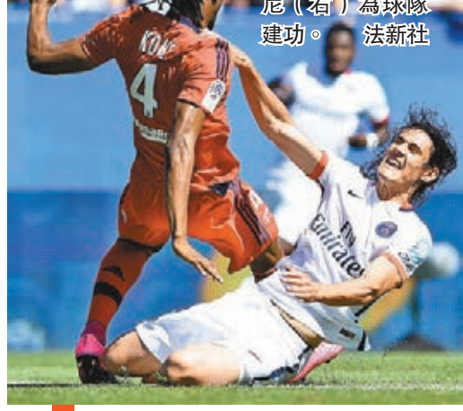
■PSG前鋒卡雲尼（右）為球隊建功。

昨晨在蒙特利爾進行法甲王者巴黎聖日耳門（PSG）對過氣勁旅里昂的法國冠軍盃（法冠盃）對決，基於後者傷兵多人腳不整，令PSG只花17分鐘便由一對球員後衛奧里亞和前鋒卡雲尼各入一球，還有里昂下半場要10人應戰，難挽狂瀾，最終PSG以2:0輕鬆勝出捧盃。這亦是PSG連續三年贏得此盃。