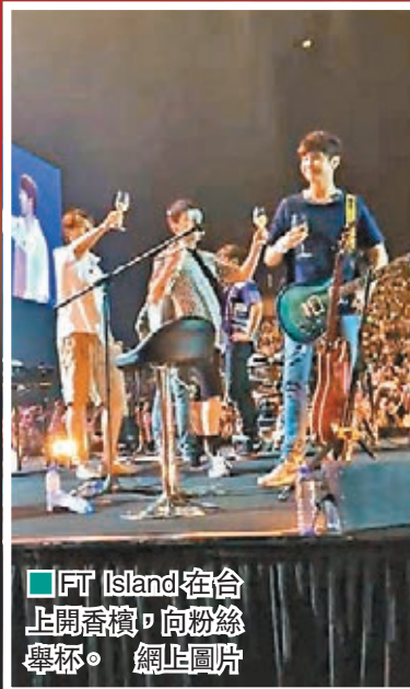
FT Island在台上開香檳，向粉絲舉杯。