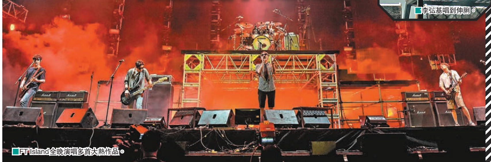
FT Island全晚演唱多首大熱作品。