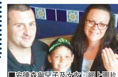
安德森與兒子及女友。