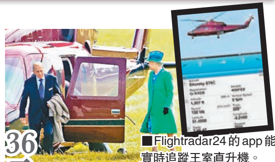
36元追蹤app 洩直升機行蹤 英女王受威脅

繼英國《星期日郵報》上週揭發有追蹤航班網站洩漏威廉王子的醫療直升機行蹤後，英國《每日快報》近日再發現，英女王及王儲查爾斯等王室人員乘坐的王室直升機，同樣能在網上被輕易追蹤。該報記者上週用2.99英鎊(約36港元)購買追蹤網站Flightradar24的手機應用程式(app)，輸入王室直升機編號，成功追蹤到直升機從女王位於桑德靈厄姆的別墅出發，以時速241公里在數百米上空飛越倫敦，最終在倫敦西北方向降落。記者利用程式更成功查到直升機在此前一星期內的12次飛行記錄，全部均附上詳盡資料。