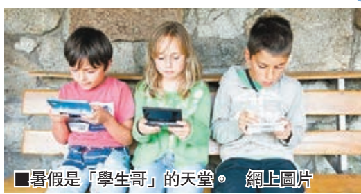
暑假是「學生哥」的天堂。

暑假是「學生哥」的天堂，對家長而言卻未必。英國火車套票計劃Family & Friends Railcard訪問1,500名家長，發現只有兩成期待暑假，更有一半家長表示踏入8月已「受夠」，近3/4家長更已花光暑假使用的子女娛樂經費。