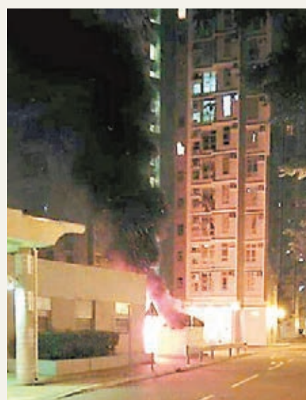
■東涌逸東邨電單車遭縱火，煙火殃及旁邊的煤氣調壓器室。

突然起火，並波及房間的煤氣設施，導致煤氣調壓器的頂部喉管一度噴出火焰，火光熊熊。當時有途人經過現場，用手机拍下「噴火」情況，由於恐煤氣設施受火勢波及，會引發煤氣大爆炸，大驚之下馬上報警。