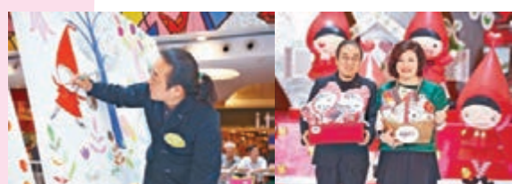
▲加藤真治首次訪港為藝 加藤真治與新鴻基(中) 術展揭開序幕，即場示範 發展董事馮秀炎。 繪畫。

所以，一眾加藤真治繪本內的經典童話主角如小紅帽與大野狼、木偶皮諾丘、愛麗絲、白兔先生等首次跳出繪本現場現身齊賀商場 10 周年，帶領大家一起遊歷 3 大童話故事場景，包括「小紅帽蛋糕 Merry go round」、「愛麗絲藝術花園」、「木偶皮諾丘限定 Zakka Store」，為大家帶來 25 呎巨型小紅帽蛋糕，10 個小紅帽雕塑更以不同姿態亮相，同場更展出加藤真治真跡手繪畫，還有引入日本直送加藤真治設計的限定生活日用精品等。