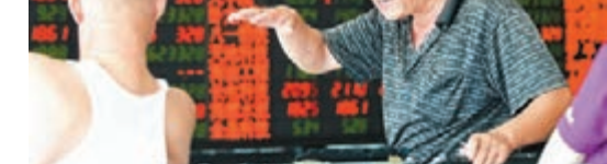
尾市一度再現抽水行情,50分鐘內滬綜指重挫近3%。

分析師指,近來市場動盪劇烈,風險偏好顯著降低,場內融資客自降槓桿,兩融餘額連日縮減已至新低,而散戶、基金、外資方面對資金面的增量貢獻也都在下降軌道,受量能約束,A股暫時難現強勢反攻行情,維持區間震盪將是大概率事件。