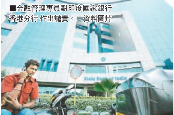
金融管理專員對印度國家銀行香港分行作出譴責。