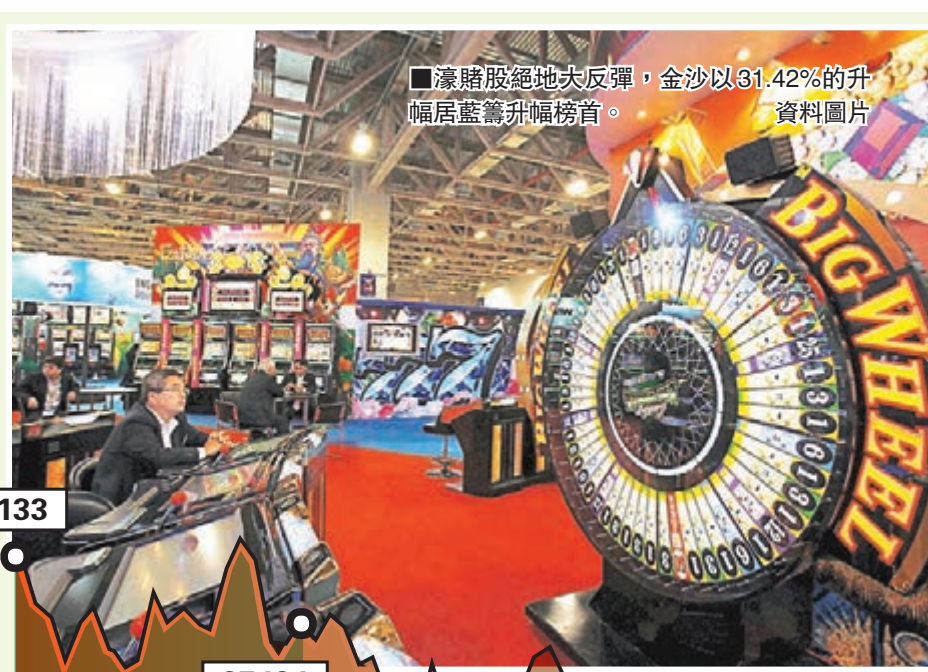
濠賭股絕地大反彈,金沙以31.42%的升幅居藍籌升幅榜首。

蘋果公司的手機銷售表現差過預期,令該股在美國下跌,並拖累一眾手機股「陪跌」,但iPhone 6s終有照片流出,據聞有玫瑰金色,市場料又會掀起新一輪蘋果熱潮,iPhone概念股有炒作,瑞聲(2018)升逾4%,但舜宇光學(2382)無受惠,股價跌4%。