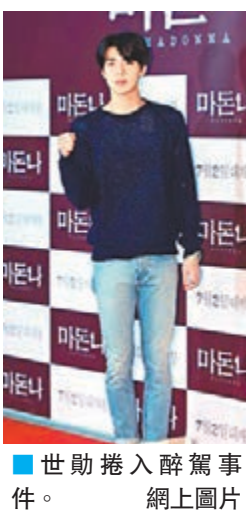
世勳捲入醉駕事件。網上圖片