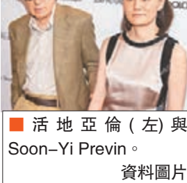
活地亞倫 (左) 與Soon-Yi Previn。資料圖片

現年79歲的名導活地亞倫 (Woody Allen) 最近接受訪問時，大談他與其44歲妻子Soon-Yi Previn的「忘年戀」。他表示：「我比她大35歲，我們兩人都沒錯，不知怎地，兩人之間起了化學變化。」他又指，他在這段關係中扮演「父親般」的角色：「我和她的關係剛開始時，以為只是一時激情。接着我們開始在一起，開始同居，我們樂在其中，年齡差異似乎並不重要，反而對我們有利。」他又指現在他們已經結婚20年，一切都很好：「我想可能是因為這個奇怪的因素，那就是我比我娶的女孩大很多。我喜歡她的青春活力，我像父親一樣，她很尊敬我，我很樂意給她大量做決定的機會當作禮物，讓她可以掌管很多事情。」