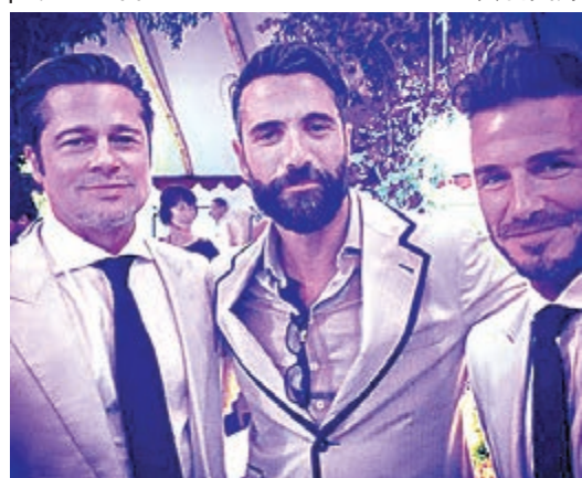
畢彼特 (左) 與碧咸 (右) 齊到賀。網上圖片