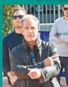
米路吉遜返回故鄉澳洲拍新片。

美國男藝人米路吉遜 (Mel Gibson) 最近回到故鄉澳洲，睽違10年再度當起導演，將二次世界大戰人物Desmond Doss的真實故事搬上大銀幕，電影取名為《Hacksaw Ridge》。該片描述Desmond Doss因為自己良心而拒絕在戰場殺敵，最後成為軍醫。