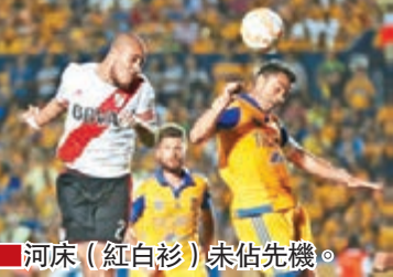
河床(紅白衫)未佔先機。