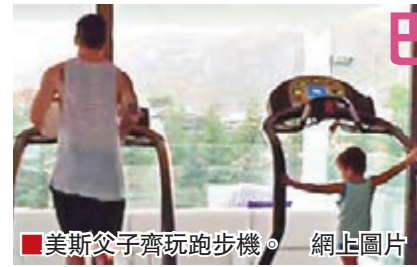
美斯父子齊玩跑步機。