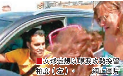
女球迷想以眼淚攻勢挽留柏度(左)。