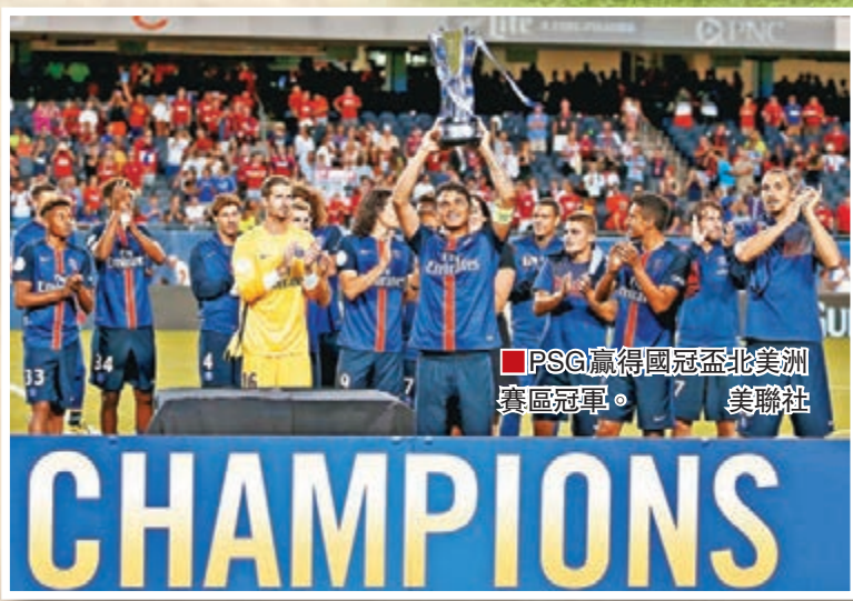
PSG贏得國冠盃北美賽區冠軍。

曼聯3勝1負，PSG則以贏賽非加、費倫拿、互射12碼負於車路士以及挫曼聯的10分佳績，搶走今夏國冠盃北美賽區獎盃。雲高爾賽後提到今場連失兩粒的迪基亞：「可能球員本身的確是希望轉會，去留拉鋸太久，對球員和球隊都很不利。」