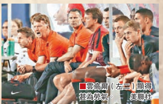
雲高爾(左二)顯得甚為鬱氣。

決心離開曼徹斯特這個傷心地的迪馬利亞未有按計劃向球會報到，被問到阿根廷「天使」如今身在何處，曼聯領隊雲高爾妙答：「或許你知而我不知他在哪裡。」紅魔今仗對手巴黎聖日耳門的主帥白蘭斯較早前透露，在羅致迪馬利亞一事上頗不掂轉會費。另外，很可能離開PSG的烏拉圭前鋒卡雲尼，是役換邊後終於落場。