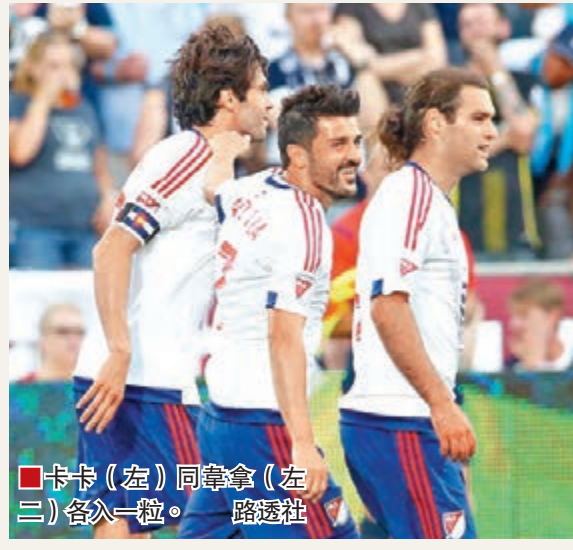
卡卡(左)同韋拿(左二)各入一粒。

兩位今年轉戰美國職業足球大聯盟的老牌球星韋拿同卡卡，昨晨一場表演賽帶領美職明星隊以2:1力克從英國來訪的熱刺。