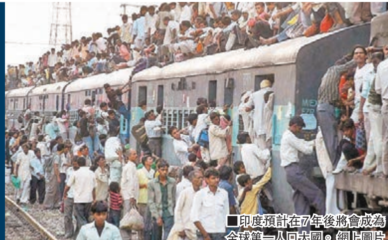
印度預計在7年後將會成為全球第一人口大國。網上圖片

聯合國經濟及社會事務部日前發佈2015年修訂版世界人口展望報告，截至今年中，全球人口為73億人，預計2050年將增至97億人，換言之在35年內，全球人口將激增24億人，其中非洲將貢獻一半增長，而印度將在7年後超越中國，成為全球人口第一大國。