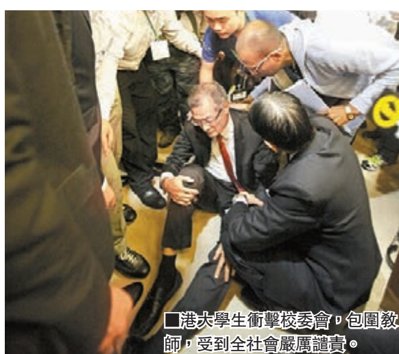
港大學生衝擊校委會，圍困教師，受到全社會嚴厲譴責。

首先，反映出今天香港社會的家庭結構已出現嚴重的失衡，導致孩子家庭教育的「道德倫理、禮義廉恥」逐漸缺失。香港在上世紀90年代以前家庭單元基本為三代同堂的大家庭結構，普通家中都有爺爺奶奶或外公外婆，及父母共同生活。且老一輩都是60年代艱苦打拚，而自己是70年代在獅子山下精神激勵下成長起來的一代。當時的生活條件雖然艱苦，但每個家庭「老中