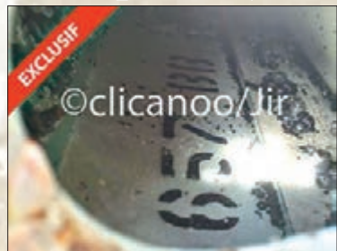
波音777襟副翼與殘骸對比圖。