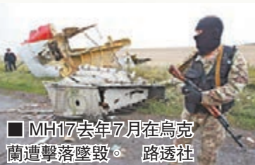
MH17去年7月在烏克蘭遭擊落墜毀。

馬航失聯MH370客機疑首次發現殘骸之際，旗下另一失事客機MH17調查工作亦有新發展。聯合國安理會前日就否設立國際法庭追究肇事者責任進行表決，15個理事國中有11個國家贊成，中國及另外2國棄權，常任理事國俄羅斯則