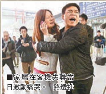
家屬在客機失聯當日激動痛哭。

MH370原定去年3月8日由吉隆坡飛往北京，載有227名乘客及12名機組人員，包括154名中國人。客機起飛後不久失去聯絡，不知所終，馬航事後停用MH370航班編號。外界紛紛揣測客機去向，包括過海、恐嚇分子劫機作自殺式襲擊，甚至被美國擊落。 ■《每日郵報》