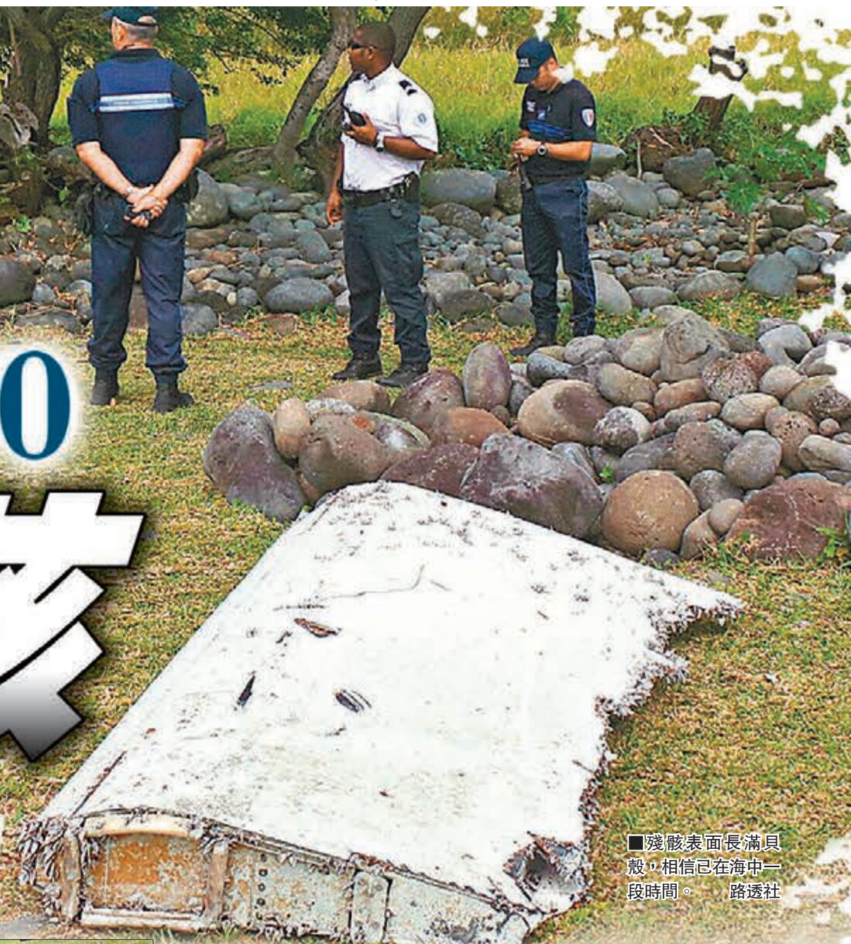
殘骸表面長滿貝殼，相信已在海中一段時間。