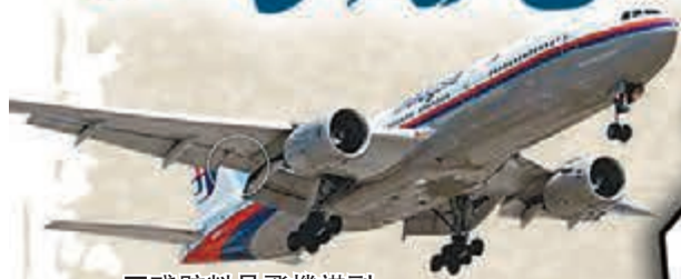
殘骸料是飛機襟副翼部分。