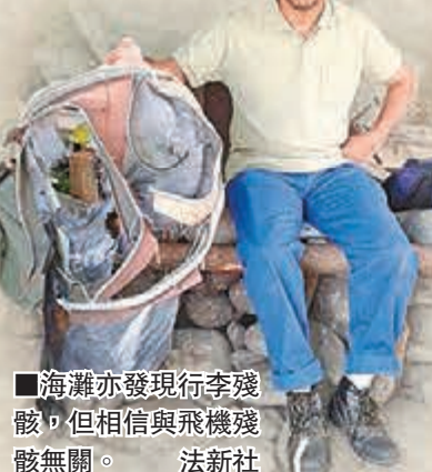
海灘亦發現行李殘骸，但相信與飛機殘骸無關。

前日發現的殘骸由島上海灘的清潔工發現，長逾2米、闊約1米，報道指上面有「BB670」字樣，表面長滿貝殼，相信已在海中一段時間，表面沒燒毀痕跡，但網上流傳照片顯示殘骸印有「657BB」，消息似乎有混淆。航空網站AirLive指出，波音777維修手冊上有「657-BB」編碼，或可證明殘骸來自波音777。另有消息指海灘亦發現行李箱殘骸，但初步調查後相信純屬巧合，或與飛機殘骸無關。