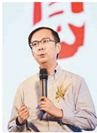
■ 阿里巴巴集團首席執行官張勇表示，10億美元的投入只是開始。資料圖片

通過是次合作，阿里雲將進一步進軍企業市場，並提供更全面的服務，以滿足不同的業務需求，更快應對本地及國際企業所面對的挑戰。用友網絡亦可利用阿里巴巴集團的生態資源，進一步拓展其企業管理軟件業務。