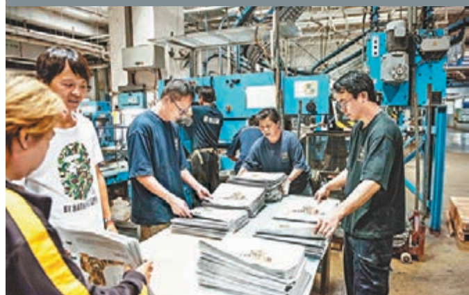
■ 壹傳媒昨日宣佈，因進行策略性整合，集團書籍、雜誌出版及印刷業務有關員工將會被解僱。

香港文匯報訊（記者 涂若奔）壹傳媒（0282）昨日公告宣佈，因進行策略性整合，集團書籍、雜誌出版及印刷業務有關員工將會被解僱，預計將會支付共3,000萬元的遣散費用。另外，《忽然1周》刊頭及版權估值為9,700萬元亦將有可能被減值，這些財務影響（如實現）將於截至2015年9月30日止六個月未經審核財務業績中反映。