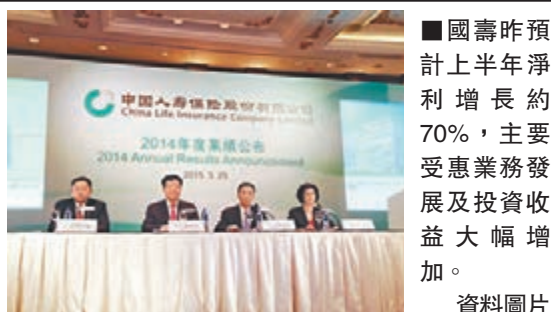
■ 國壽昨預計上半年淨利增長約70%，主要受惠業務發展及投資收益大幅增加。資料圖片

香港文匯報訊（記者 張易）繼平保（2318）、太保（2601）發盈喜後，國壽（2628）昨公佈，預計上半年淨利增長約70%，主要受惠業務發展及投資收益大幅增加。該股昨收報29.65元，升1.37%。 人行年內三度減息或令壽險的定息投資受壓，然而滬指上半年累升32%，權益類收益表現向好，並推動險商整體盈利增長。國壽去年同期錄得淨利184.07億（人民幣，下同），今年首季淨利已達122.71億元。