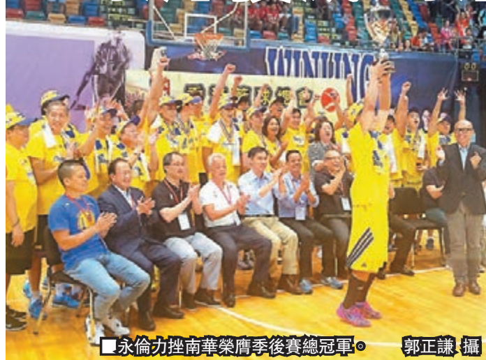
永倫力挫南華榮膺季後賽總冠軍。

香港文匯報訊(記者郭正謙)「無敵」泰那助永倫登頂!昨晚進行的甲一季後賽終極戰成為泰那個人表演舞台,這名永倫射手個人獨取46分成為贏波功臣,帶領球隊以82:78力挫南華,以總場數3:2勝出,成為季後賽總冠軍。