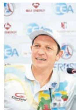
沙柏本週末將來港。