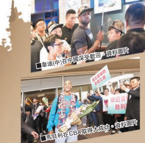
韋迪(中)在中國深受歡迎。資料圖片