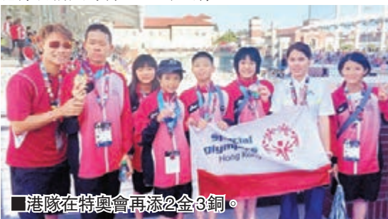
港隊在特奧會再添2金3銅。資料圖片

港隊在洛杉磯特奧會次日賽事再添2金3銅,其中泳隊摘得1金2銅,而保齡球隊及滾球隊則分別奪得1金1銅,連同首日賽事泳隊拿下的3金1銀成績,港隊目前共奪得5金1銀3銅。