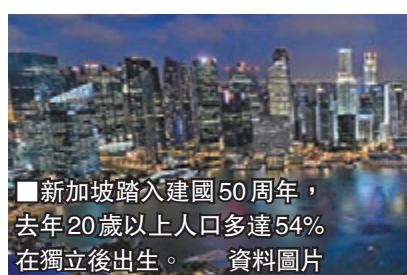
■新加坡踏入建國50周年，去年20歲以上人口多達54%在獨立後出生。

的重大考驗。年輕選民大致仍然滿意人民行動黨執政，但在公共交通、人口管理及公民自由方面不滿聲音漸增，預料這些方面將成為大選關鍵議題。38歲的鍾先生坦言人民行動黨「做得很好」，但希望反對黨能拿下更多議席，而他將投票給反對派。亦有選民憂慮李光耀逝世後，政府會只顧迎合選民，失去長遠理念。