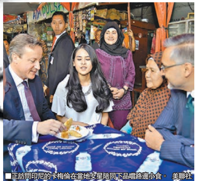
■正訪問印尼的卡梅倫在當地安星陪同下品嚐路邊小食。