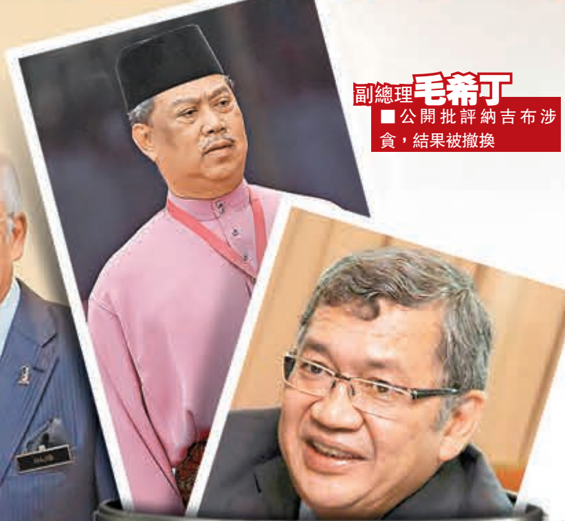
副總理毛希丁 ■公開批評納吉布涉貪，結果被撤換