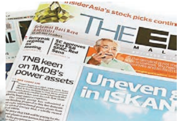
■The Edge旗下兩本刊物因報導總理涉貪，遭勒令停刊。