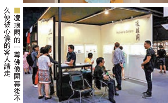
■凌琅閣的一尊佛像開幕後不久便被心儀的客人請走