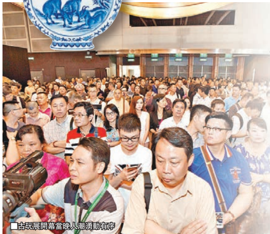
■古玩展開幕當晚人潮湧動有序

由5月29日剪綵至6月1日閉幕的本年度香港國際古玩展，早已曲終人散，但回憶起當日假香港會議展覽中心展覽廳5BC熱鬧舉行的四天展覽，不管是買家、參展商，抑或入場參觀人士和主辦方，仍然津津樂道。應了本版上期為這次展覽所作的預期：國際古玩藝術品投資市場與「適應經濟發展新常態」概念基本吻合，出現快速回暖與復甦的大形勢。 ■文：麥默