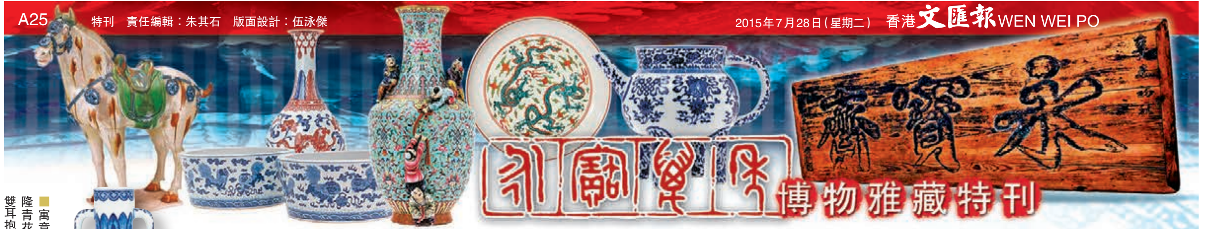
■寓意吉祥的乾隆青花三陽開泰雙耳抱月瓶