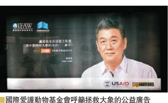
■國際愛護動物基金會呼籲拯救大象的公益廣告

他指出，目前每年2.5至3萬頭大象慘遭殺害，僅前兩年，全球查獲大宗走私象牙總量為41.6噸，在過去三十年間，非洲象群數量從120萬至130萬頭下降到40萬至60萬頭。另有數字顯示，20世紀初三四十年代全球有大象3百至5百萬頭，1980年代有120萬頭，現