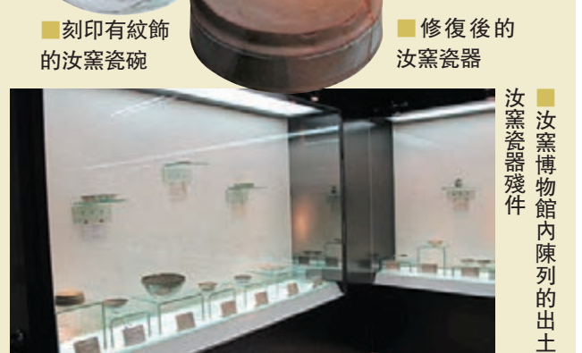
■刻印有紋飾的汝窯瓷碗 ■修復後的汝窯瓷器