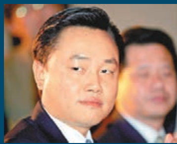
國美控股股東黃光裕。資料圖片

補，令集團於全國的覆蓋，由269個城市大幅拓展至436個城市，且新增城市多數位於國家經濟產業扶持帶和增長潛力巨大的二三線城市，門店網絡高度互補。