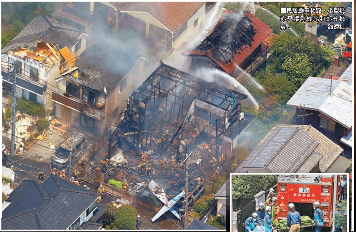
民居嚴重焚毀，小型機亦只燒剩機尾和部分機

日本東京西部的調布市昨日發生致命墜機意外，一架載有5人的小型飛機，從調布小型機場起飛後不久失事，墜落距機場僅500米的住宅區，引發大火，最少3人死亡、5人受傷，死者分別是機師、機員和地面一名女性。日本運輸安全委員會已派人到現場調查飛機失事原因，警方稱出事飛機當時正進行飛行訓練，原定飛往東京以南100公里的伊豆大島。