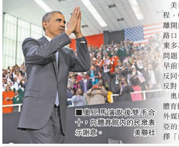
奧巴馬演說後雙手合十，向體育館內的民眾表示謝意。美聯社

美國總統奧巴馬昨日結束肯尼亞訪問行程，轉赴埃塞俄比亞繼續非洲之旅。奧巴馬離前發表演說，形容肯尼亞當處於十字路口，同時充滿風險和機遇，呼籲肯尼亞摒棄多項陋習，包括已成「風土特色」的貪腐問題，以及種族和性別歧視等。不過奧巴馬早前與肯尼亞總統肯雅塔會談時，批評當地反同性戀政策侵害自由，引來不少肯尼亞人反對。 奧巴馬前日在肯尼亞首都內羅畢一個室內體育館向4,500人演說，全長約40分鐘，國內外媒體均進行電視直播。演講內容關注肯尼亞的未來發展，奧巴馬呼籲肯尼亞人一同選擇「向前邁進的道路，即使需要作出艱巨決定」。他呼籲肯尼亞的未來領袖解決貪腐、部落衝突，改善醫療和教育，提升婦女地位，為所有人創造機會。肯尼亞約六成人口是24歲以下，奧巴馬特別向新一代發聲，「我相信你們前途無可限量，可達成任何事，在這個國家你可以建構自己的將來」。 同性戀在肯尼亞屬違法，最高可判監14年。奧巴馬早前就此作出批評，認為歧視他人性向與種族歧視無異。肯雅塔隨即反擊，稱肯尼亞和美國有很多共同價值，但同性戀並非其中之一，不少肯尼亞人亦對奧巴馬的言論表示反感，認為他「管太多」及不尊重肯尼亞文化。 ■路透社/法新社/美聯社