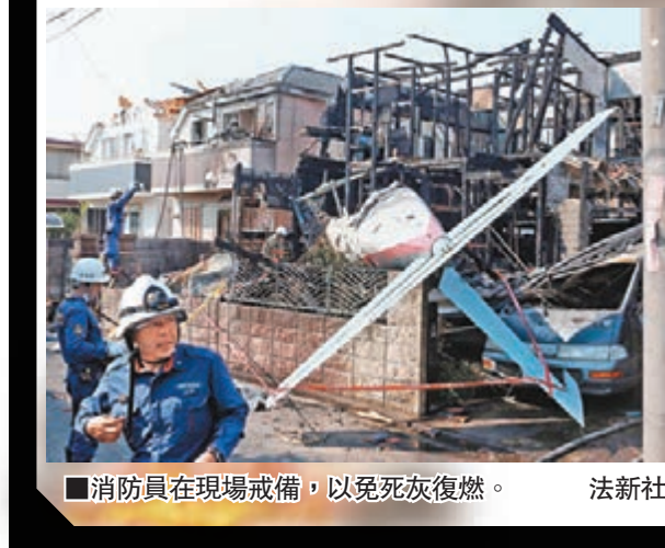
消防員在現場戒備，以免死灰復燃。