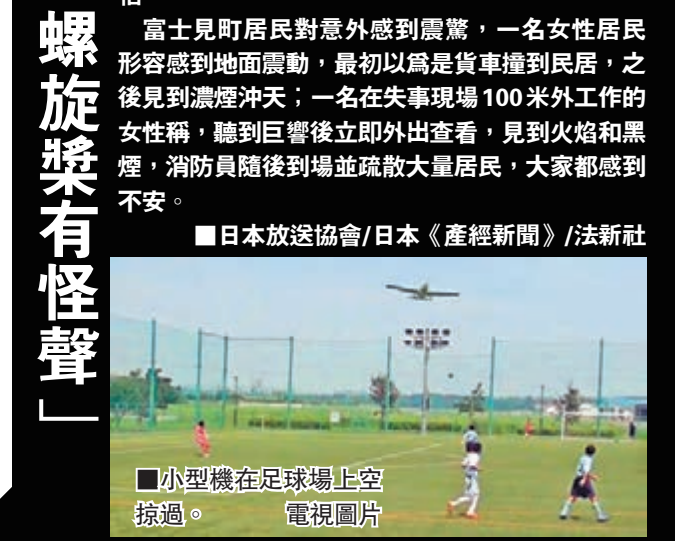
小型機在足球場上空掠過。電視圖片

低空掠過球場 「螺旋槳有怪聲」 調布機場南邊的西町足球場發一則正進行中學練習賽，有現場片段拍到失事飛機從機場起飛後，飛過球場上空一刻，再過10多秒便傳來巨響，並聽到現場觀眾驚呼：「掉下來了嗎？」「不好了！不好了！」在球場目擊墜機過程的中學生指出，當時小型飛機飛行高度較低，螺旋槳的聲音亦有點怪。 接受傳媒訪問的幾名中三學生表示，因為球場鄰近機場，故已習慣飛機升降，但昨日感覺到小型飛機較往常更接近地面，幾乎僅僅掠過球場圍欄，而且螺旋槳聲音亦不太一樣。其中一名學生稱，飛機墜落後見到很多拳頭般大的煤焦飛到球場內，另一人則表示想到飛機可能墜落球場，感到非常害怕。 富士見町居民對意外感到震驚，一名女性居民形容感到地面震動，最初以為是貨車撞倒民居，之後見到濃煙沖天；一名在失事現場100米外工作的女性稱，聽到巨響後立即外出查看，見到火焰和黑煙，消防員隨後到場並疏散大量居民，大家都感到不安。 ■日本放送協會/日本《產經新聞》/法新社