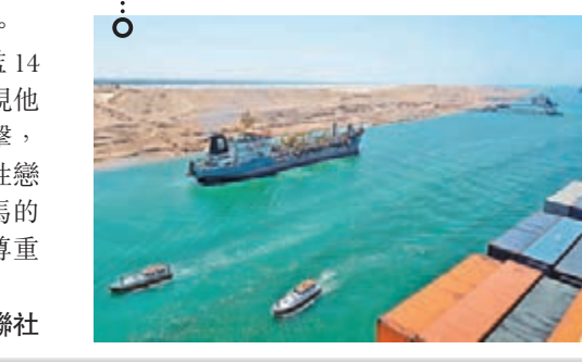
埃及新蘇伊士運河前日首度試航。路透社

耗時11個月建造、花費共85億美元(約656億港幣)的埃及新蘇伊士運河前日首度試航，首批3艘船隻順利通過新水道，為下月6日正式啟用的運河帶來一個好開始。埃及總統塞西寄望新水道能擴大亞洲與歐洲之間的貿易額，成為埃及國家新標誌。 新蘇伊士運河部分航道與原有的蘇伊士運河平行，容許大型船隻雙向航行，所需航行時間亦從現時22小時縮減至11小時。蘇伊士運河每年為埃及帶來約50億美元(約386億港幣)收益，當局希望新運河啟用後，收益到2023年可增至150億美元(約1,157億港幣)。 ■英國廣播公司/路透社 埃及新蘇伊士運河前日首度試航。路透社