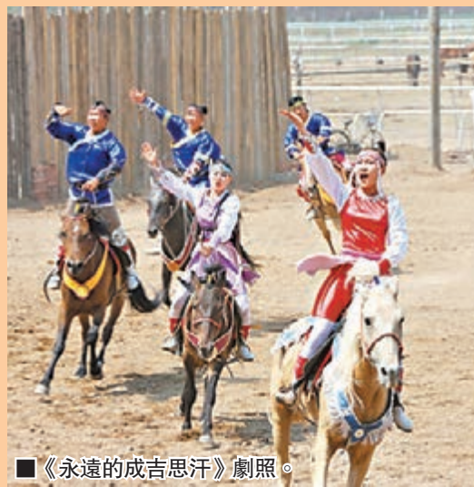
■《永遠的成吉思汗》劇照。

早前，《永遠的成吉思汗》在內蒙古呼和浩特市賽馬場上演，該劇由內蒙古體育局、內蒙古旅遊局主辦，內蒙古澳都文化傳媒公司、內蒙古賽馬場、內蒙古馬術協會承辦，是內蒙古和蒙古國著名表演團體合作推出的草原民族傳統文化展示的重要項目。其中，參與表演的演員約50名，都是20歲左右的年輕人，全部來自蒙古國，以蒙古族馬術表演為主，講述成吉思汗的故事。此劇計劃在草原旅遊旺季每天推出兩場演出，每場演出參演馬匹60匹，演員70人，演出時間為50分鐘。