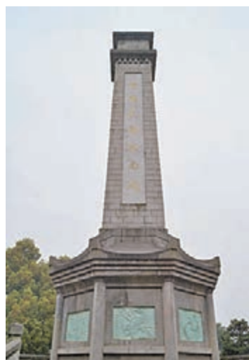
■為紀念衡陽抗戰史而修建的衡陽抗戰紀念城碑。