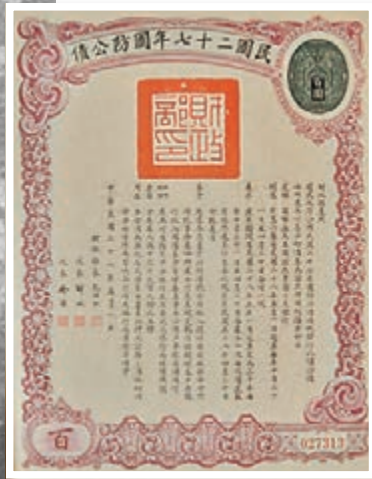
■抗戰時期的國防公債。