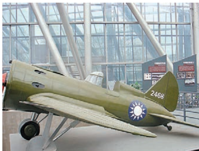
■陳列於南京的抗戰時期中國空軍戰機。

抗戰時海陸空的全方位作戰，史料的獲得、記錄、流傳，對於研究歷史、銘記歷史有着特別重要的意義。因此，《八年抗戰之經過》確是一部值得閱讀的抗戰史料。