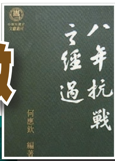
■《八年抗戰之經過》，何應欽著。