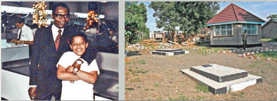
■兒時奧巴馬與父親。 ■奧巴馬父親和祖父的墳墓。

美國總統奧巴馬今日到訪非洲國家肯尼亞，是他任內首次返回父親故鄉，亦是史上首位到訪肯尼亞的在任美國總統。近年恐怖主義籠罩非洲，站在反恐最前線的肯尼亞多次成為恐襲目標，預料奧巴馬將主力推動兩國反恐及經貿合作，加強美國對非洲反恐戰線的支援，亦嘗試拉攏非洲抗衡中國在當地的影響力。