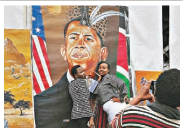
■肯尼亞再掀奧巴馬熱潮，兩名女子在他的肖像畫前留影。

近年新興經濟體陸續崛起，自奧巴馬2009年上任美國總統以來，非洲整體經濟以每年逾5%的速度急速增長，足證潛力豐厚。然而相比中國、歐洲甚至加拿大早年積極在非洲建立影響力，奧巴馬首屆任期卻把精力放在亞洲及中東，到第二期才向非洲招手，被認為是亡羊補牢，有外交專家更形容奧巴馬錯失了「非洲機會」。