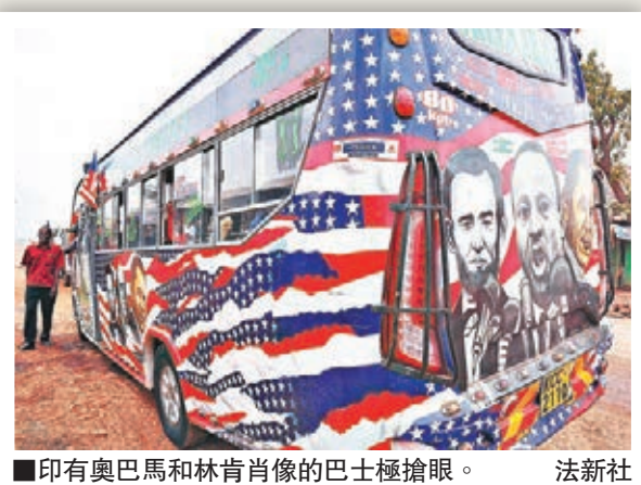
■印有奧巴馬和林肯肖像的巴士極搶眼。