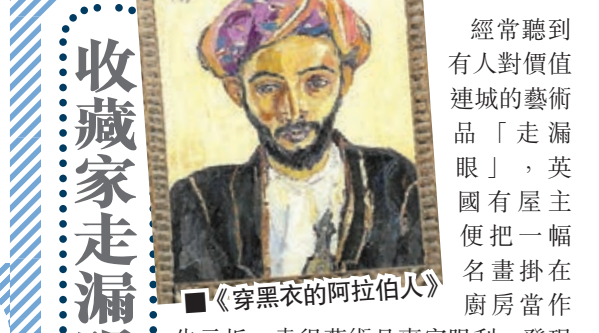
《穿黑衣的阿拉伯人》

經常聽到有人對價值連城的藝術品「走漏眼」，英國有屋主便把一幅名畫掛在廚房當作告示板，幸得藝術品專家眼利，發現此畫來頭不小，估計價值高達150萬美元(約1,163萬港元)。邦瀚斯拍賣行南非藝術品主管奧萊利早前到倫敦一名藝術品收藏家的寓所，為收藏品估價。奧萊利赫然發現廚房掛着南非著名畫家斯特恩的作品《穿黑衣的阿拉伯人》(Arab in Black)，卻被用作告示板張貼便利貼和賬單。原來斯特恩曾於1960年代初，把此畫售給南非收藏家，以籌募經費，為當時反對種族隔離政策而被控叛國罪的曼德拉和其他非洲人國民大會活躍分子打官司。這名南非收藏家後來移居英國，臨終前把此畫送贈現時的主人。