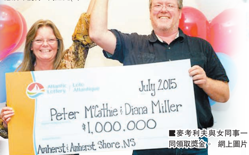
麥考利夫與女同事一同領取獎金。