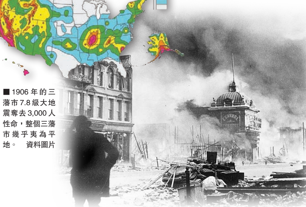
1906年的三藩市7.8級大地震奪去3,000人性命，整個三藩市幾乎夷為平地。資料圖片