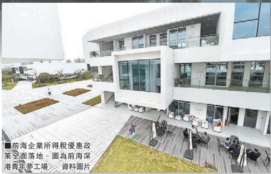
前海企業所得稅優惠政策全面落地。圖為前海深港青年夢工場。

香港文匯報訊(記者 李望賢 深圳報道)前海對企業的吸引力不僅在於發展空間大,還有一些實在的優惠政策,包括比現行的25%企業所得稅率優惠更多的稅收新政。前海管理局日前發佈《前海企業所得稅優惠產業認定操作指引》,企業可根據該指引,明確是否可以享受15%的企業所得稅優惠並進行申報。至此,前海企業所得稅優惠政策終於全面落地。