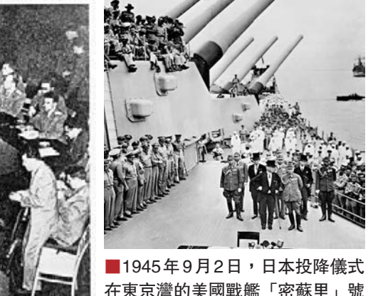
1945年9月2日，日本投降儀式在東京灣的美國戰艦「密蘇里」號上舉行。