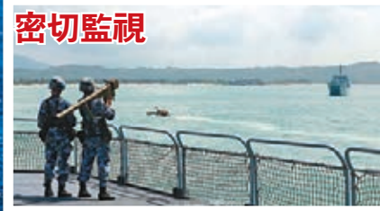
7月中旬，南海艦隊某登陸艦支隊出動十餘艘艦艇，聯合陸戰旅、航空兵、兩棲裝甲部隊等多個兄弟單位組成立體登陸輸送編隊，輾轉多個海域開展複雜電磁環境下的實戰化演練。

中國海軍局網站7月22日發佈航行警告，南海自7月22日8時至7月31日8時在諸點連線水域範圍內進行軍事訓練，禁止駛入。