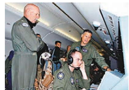
美國海軍太平洋艦隊司令搭乘P-8A「海神式」巡邏機巡南海。

中國國防部新聞事務局20日就此回應說，長期以來，美軍艦機對華進行高頻率、大範圍抵近偵察，嚴重損害雙方互信，危害中方安全利益，極易引發海空安全事件和意外事件。對於這種行為，中方堅決反對。