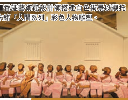
■香港藝術館設計師搭建白色街景以襯托朱銘《人間系列》彩色人物雕塑。