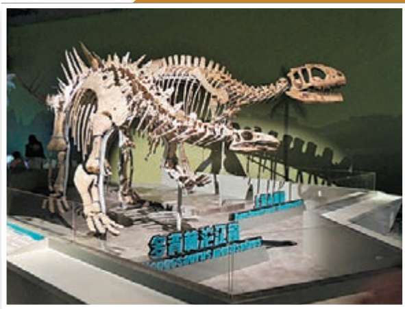
■香港科學館設計師為學習化石骨架組裝方法，特前往甘肅、雲南、重慶實地考察。