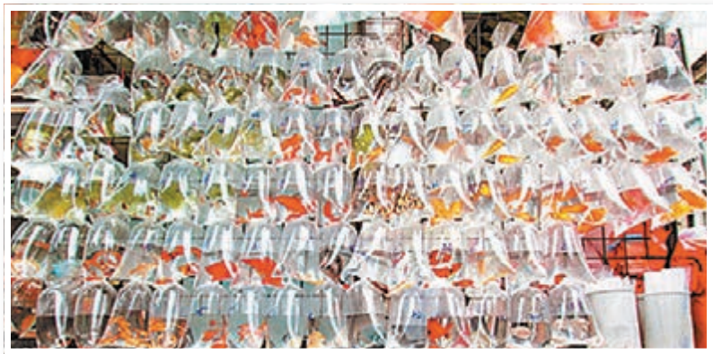
■啫喱蠟冷卻後酷似金魚袋中的培養水。