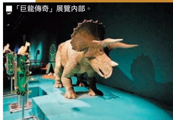
■「巨龍傳奇」展覽內部。