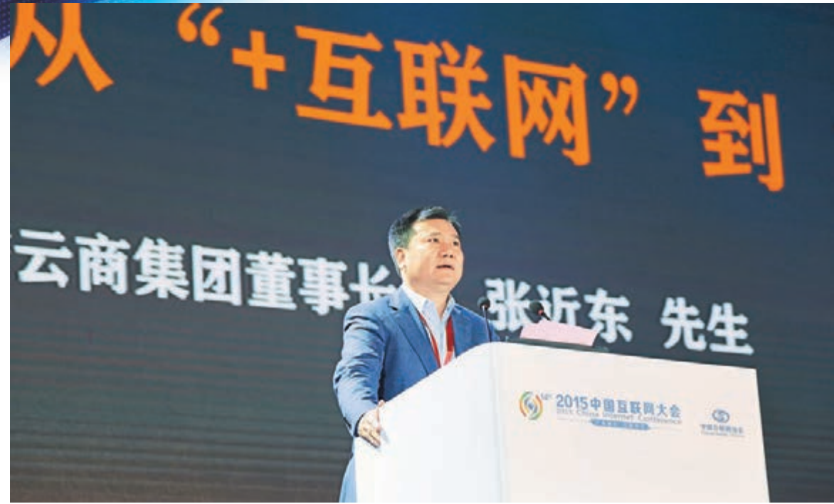
蘇寧雲商董事長張近東昨日在中國互聯網大會上作主題發言。