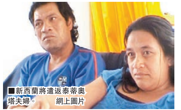
新西蘭將遣返泰蒂奧塔夫婦。網上圖片