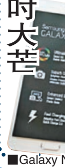
Galaxy Note 4