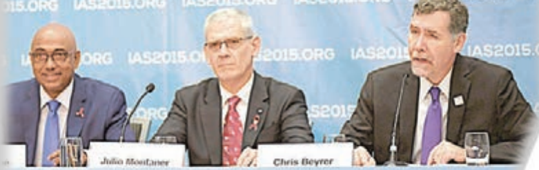
國際愛滋病學會前日在溫哥華舉行會議。

法國專家賽斯西里翁表示，法國一名18歲少女天生感染愛滋病毒(HIV)，自出世後直接受藥物治療直至5歲，其後醫生沒繼續開藥，但密切監察她的情況，確認她體內的HIV病毒在過去逾12年來一直受控，沒有引發愛滋病。研究團隊並未判斷她已完全康復，但憑她的病例顯示，HIV患者及早接受藥物治療，可有效長期控制病毒，為治療愛滋病帶來突破。