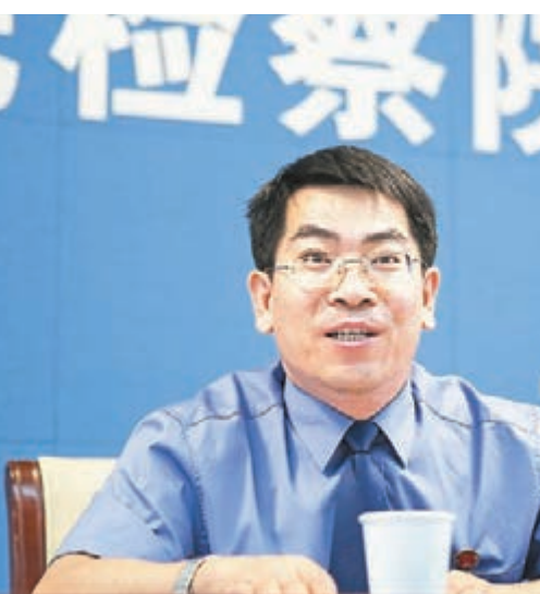
■最高檢職務犯罪預防廳副廳長陳正雲表示，總的看，涉農扶貧領域的職務犯罪仍在高位徘徊，處於易發多發的態勢。中新社