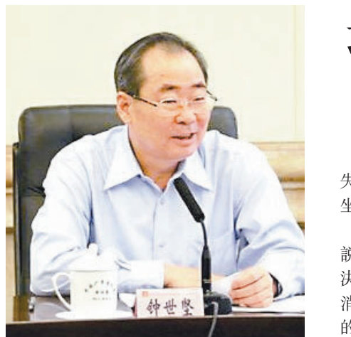
■廣東省紀委原副書記鍾世堅紀違法被雙開。資料圖片

香港文匯報訊 據新華社報道，經中共中央批准，中共中央紀委日前對廣東省紀委原副書記、監察廳廳長鍾世堅嚴重違紀問題進行了立案審查。