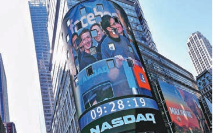
希臘危機化解後，資金再湧入美股，上週五納斯達克指數創出5210點歷史新高。資料圖片