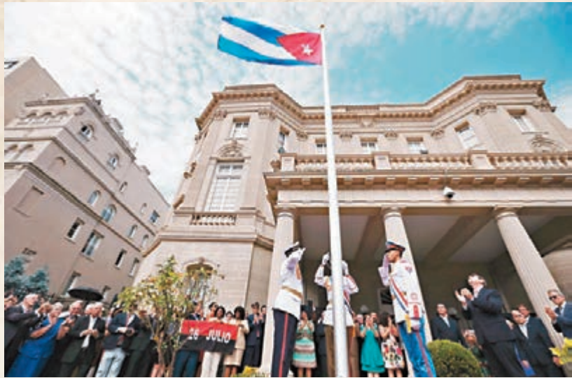
■位於美國華盛頓的古巴大使館，昨日起古巴國旗。