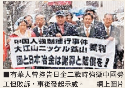
■有華人曾控告日企二戰時強徵中國勞工但敗訴，事後發起示威。

日本政府曾先後在2009年及2010年兩度向美戰俘道歉，與對待中韓的態度明顯有別，主要原因是日美的特殊同盟關係。今次與木村同行的非常務董事岡本行夫與日本政府關係密切，此前曾任外交官及派駐美國，現時擔任首相安倍晉三的特別顧問，分析認為今次事件或是日本的形象工程，為安倍下月發表戰後70周年談話鋪路。