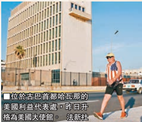
■位於古巴首都哈瓦那的美國利益代表處，昨日升格為美國大使館。 法新社

美國去年底宣佈將與古巴復交以來，先後放寬多項針對古巴的旅遊、貿易及匯款限制，又把古巴剔出支持恐怖主義名單。分析認為，美國與古巴在許多議題上仍存在歧見，預料兩國關係正常化進程緩慢。至於美國對古巴已實施逾半世紀的貿易禁運，則需要共和黨控制的國會通過才能撤銷。 ■美聯社/法新社/路透社