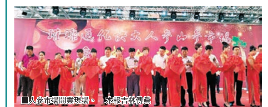
人參市場開業現場。

香港文匯報訊（實習記者 張睿航 吉林報導）通化快大人參市場16日在吉林省通化縣琿山經濟開發區通化快大人參產業園盛大開業。通化市是吉林省人參的主產區之一，未來這裡將被打造成成人參、山參、西洋參、土特產品為一體的集研發、生產、倉儲、貿易、加工銷售文化集散地，推動人參產業做大做強。