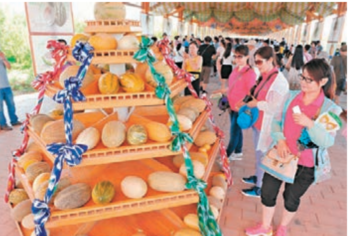
新疆哈密瓜節 昨日，「甜蜜之旅」第十二屆哈密瓜節在新疆哈密瓜園開幕，本屆哈密瓜節以「甜蜜瓜鄉·文化哈密」為主題，共展出150餘種精品有機哈密瓜，遊客和市民可以免費品嚐。圖為遊客在觀賞展出的哈密瓜。

香港文匯報訊（記者 李兵，實習生 宗露寧 綜合報導）科技部日前發佈的《全球生態環境遙感監測2014年度報告》（下稱「報告」）中，新增了「大型國際重要濕地」專題。中國有46處濕地被列入《國際重要濕地名錄》，四川若爾蓋國家級自然保護區名列其中。據悉，這是國際上首次利用衛星遙感技術在全球範圍內對大型國際重要濕地進行的監測分析。《報告》還對全球100處大型國際重要濕地以及中國20處國際重要濕地的狀況及變化進行了客觀評價。