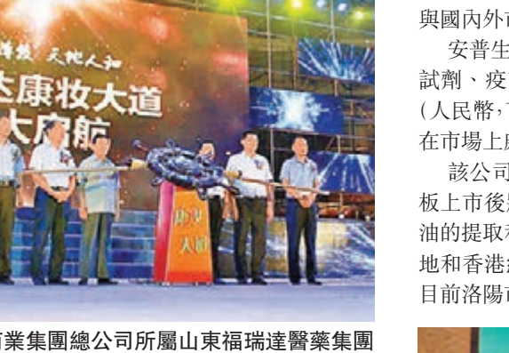
山東商業集團總公司所屬山東福瑞達醫藥集團公司18日正式啟動「O2O+直銷」模式。

談到未來的發展預期，福瑞達「康妝大道」負責人表示，公司背靠千億魯商集團產業，實力有保障。