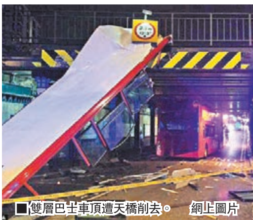
雙層巴士車頂遭天橋削去。

英國倫敦南部前晚發生罕見交通意外，一架雙層巴士的司機懷疑行錯路，駛進一條限高僅3.7米的天橋底路段，結果整個巴士車頂遭橋身削去，7名乘客受輕傷。