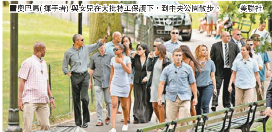
奧巴馬(揮手者)與女兒在大批特工保護下，到中央公園散步。