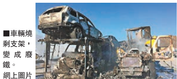
車輛燒剩支架，變成廢鐵。網上圖片