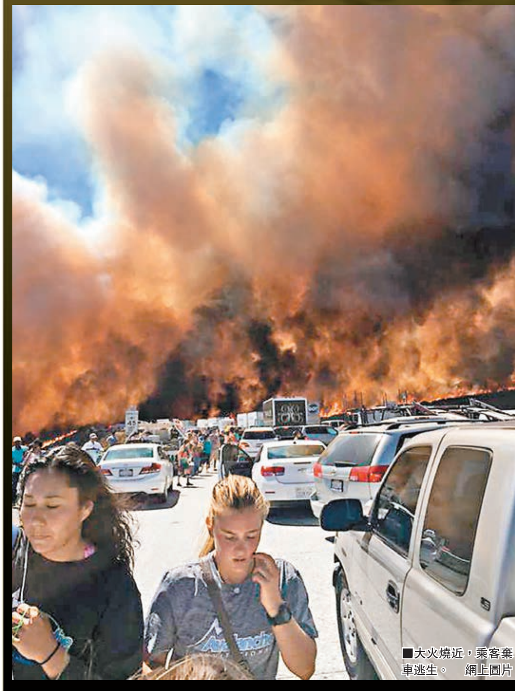
大火逼近，乘客棄車逃生。