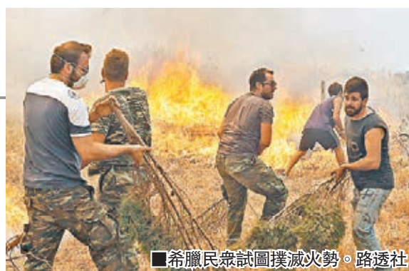
希臘民眾試圖撲滅火勢。