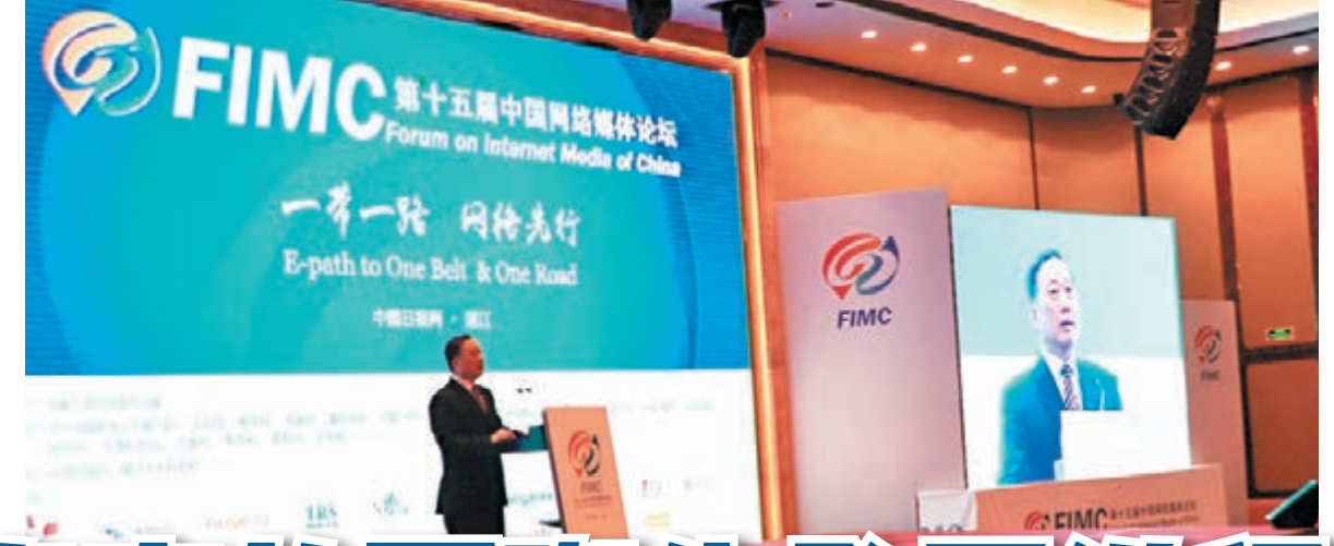
國家互聯網信息辦公室副主任任賢良