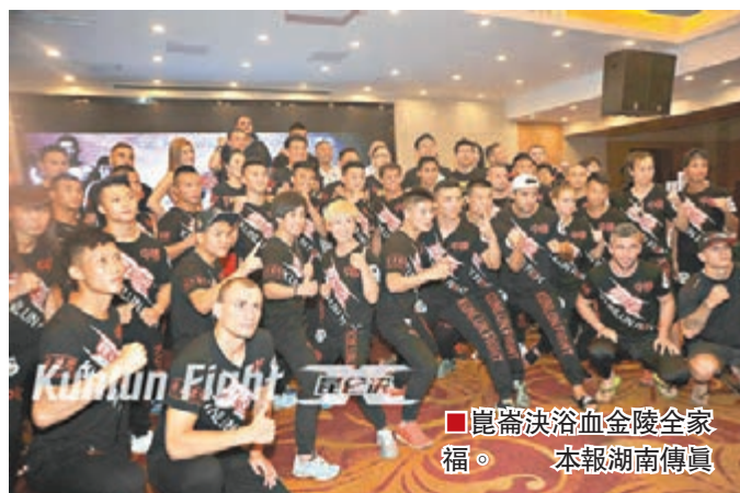
■崑崙決浴血金陵全家福。