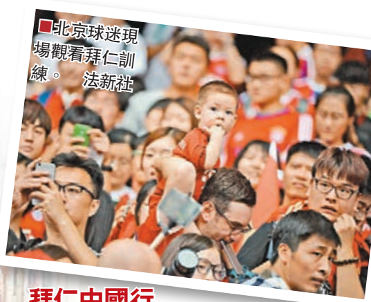
■北京球迷現場觀看拜仁訓練。